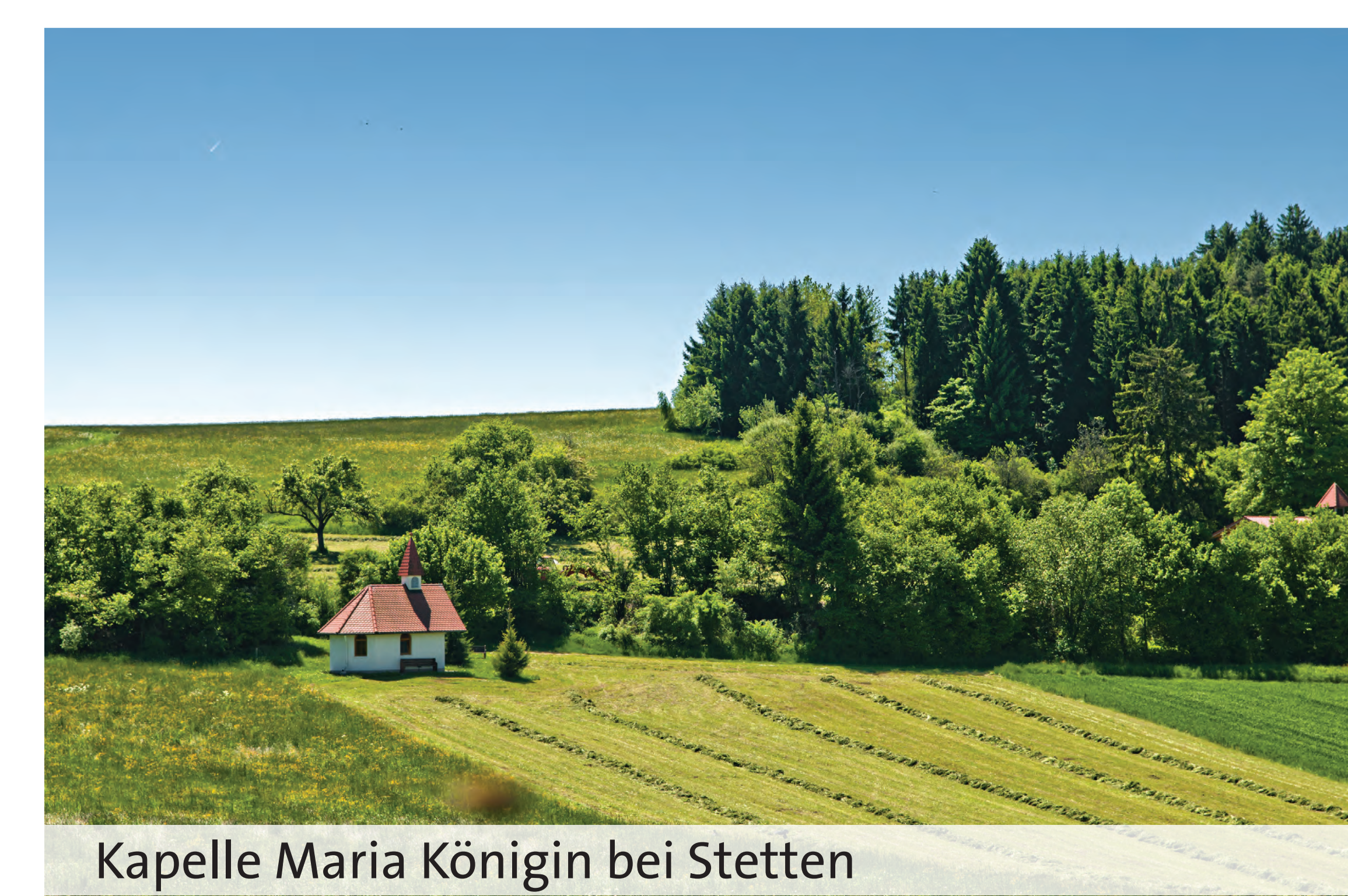
Kapelle Maria Königin bei Stetten