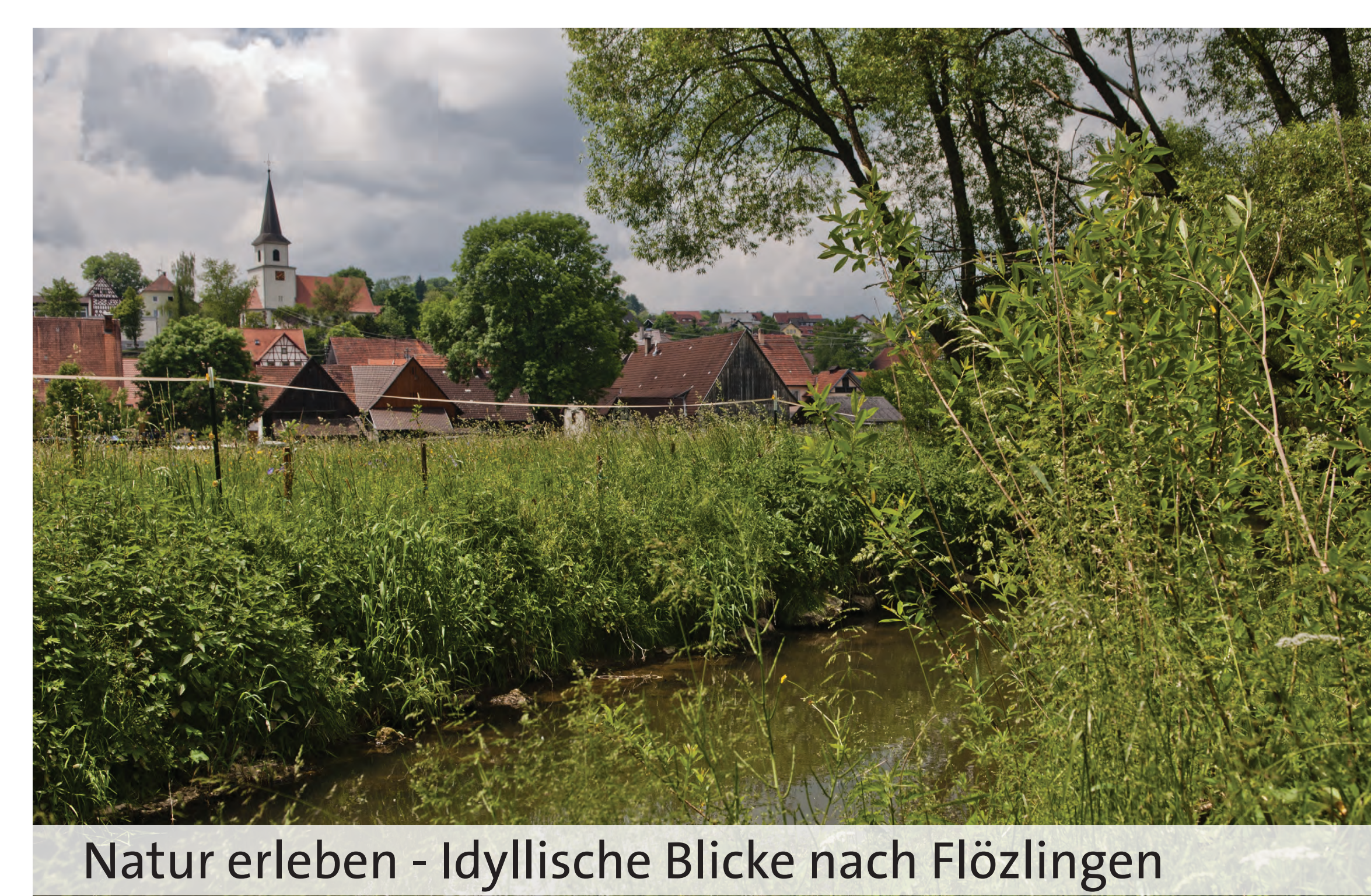
Natur erleben - Idyllische Blicke nach Flözlingen