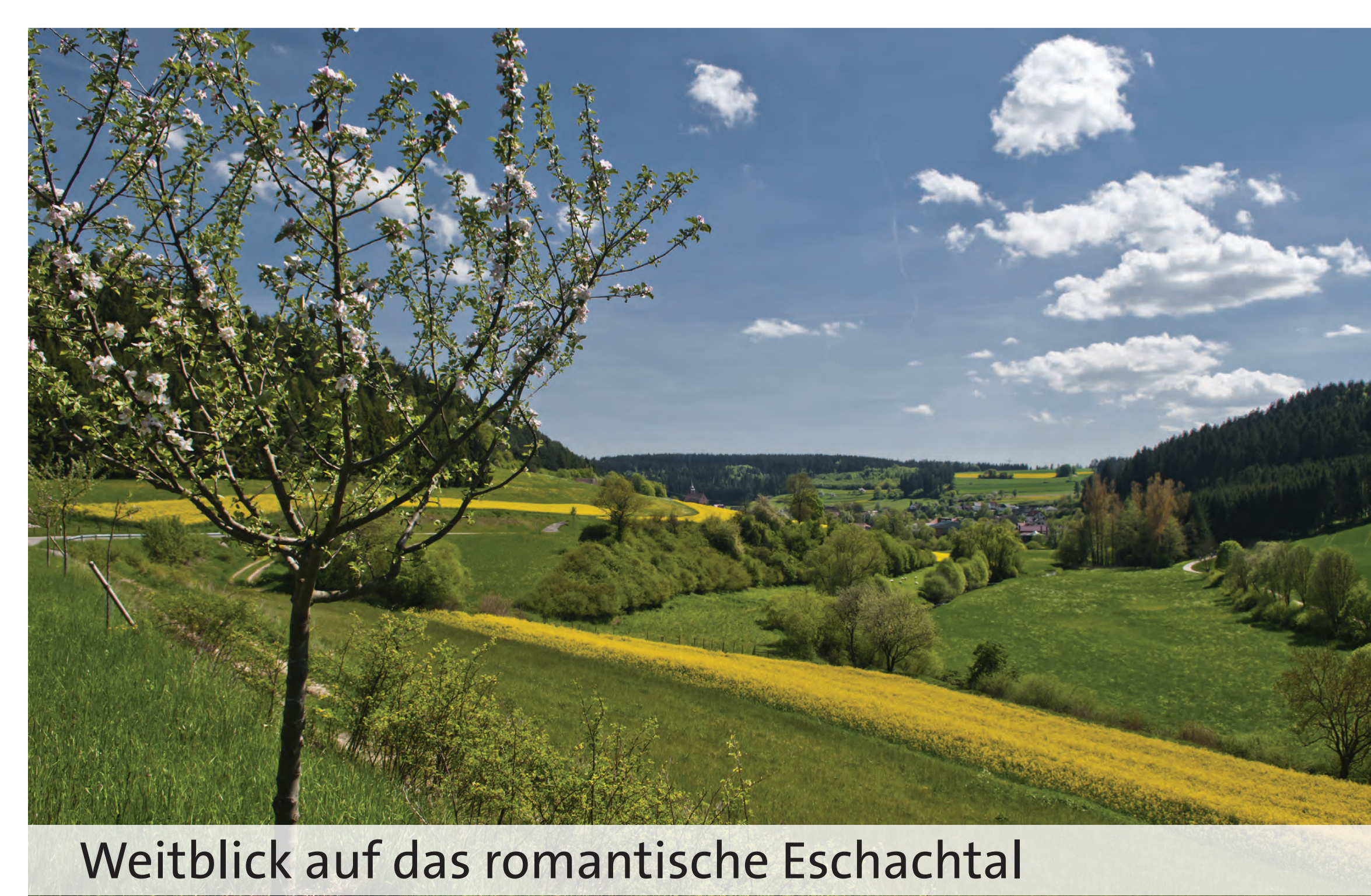
Weitblick auf das romantische Eschachtal