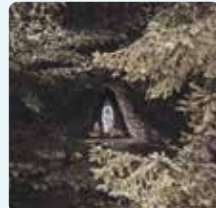
WASSERTRETANLAGE NACH KNEIPP-ART – HORGEN Ein Waldwanderweg führt Sie dorthin, wo Sie sich nach den Regeln der Kneippschen Lehre an Armen und Beinen erfrischen können – Abhärtung tut gut.