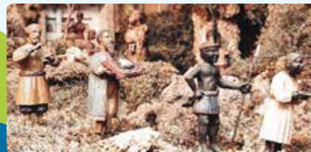
BEUTERKRIPPE – STETTEN Die Stettener Beuterkrippe zählt zu den herausragenden Zeugnissen der zeitgenössischen Volkskunst im Landkreis Rottweil. Hat eine Fläche von annähernd 17 Quadratmetern – 100 Einzelfiguren & Figurengruppen.