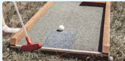
MINIGOLF & KINDERSPIEL-PLATZ IN HORGEN Entspannung & Spaß & Freude für Jung und Alt