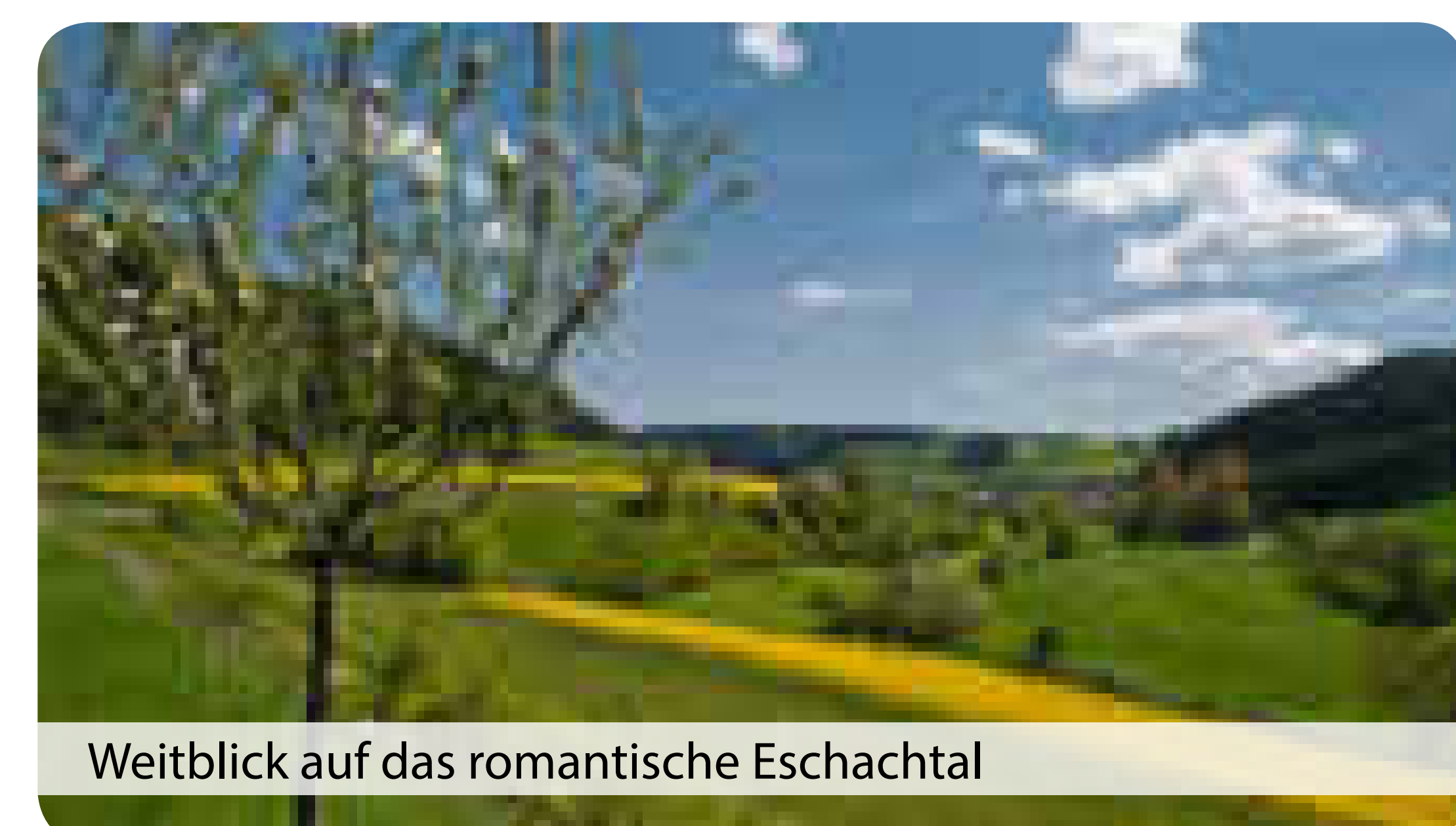
Weitblick auf das romantische Eschachtal

Kartengrundlage: Daten von OpenStreetMap – Veröffentlicht unter CC-BY-SA 2.0 / www.openstreetmap.org/copyright, Kartenbearbeitung / -Layout: MarCo Consulting