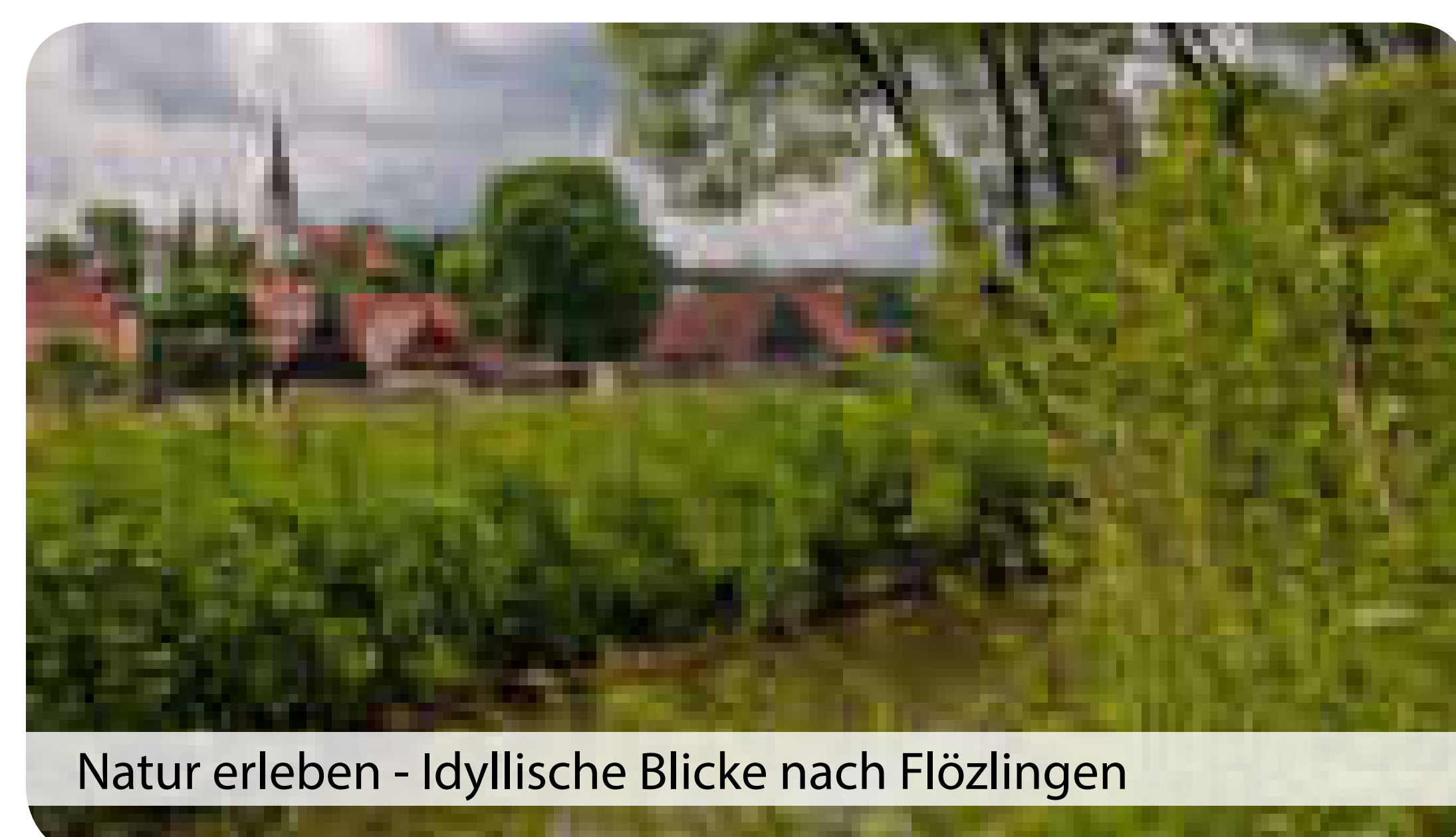
Natur erleben - Idyllische Blicke nach Flözlingen