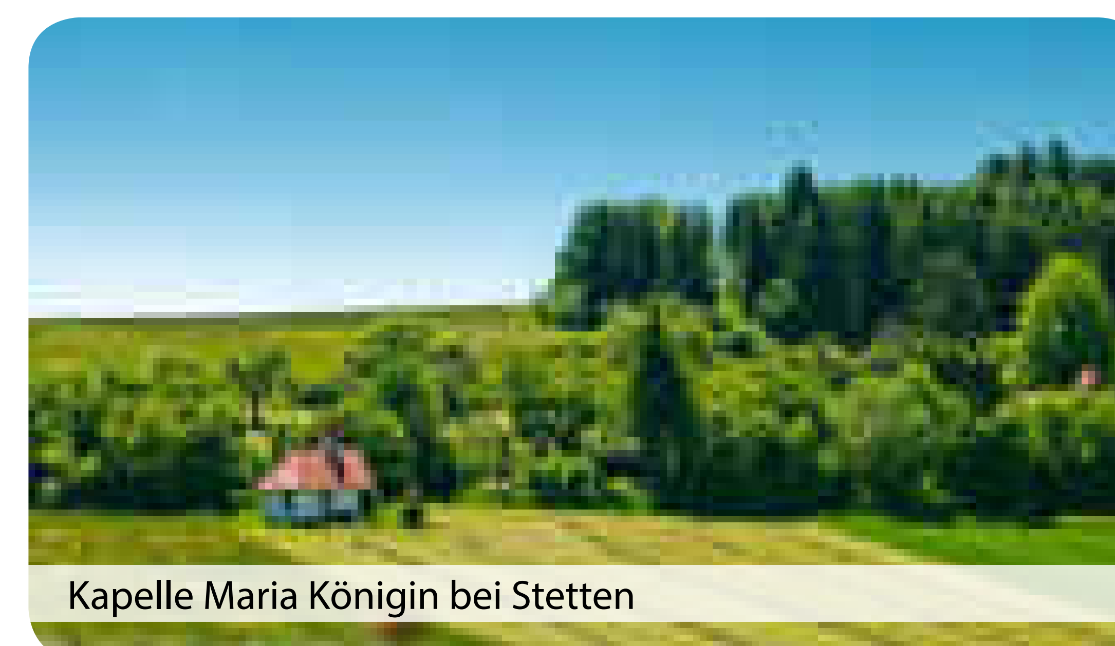
Kapelle Maria Königin bei Stetten