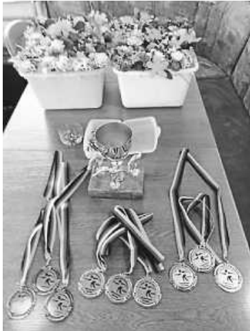
Liebevoll gebundene Blumen-Sträußchen gab es in Überzahl

Am Sonntag trifft die 3. Mannschaft (Platz 11) auf BC Ennetach 2 (10) und den BBBC Singen 2 (8)