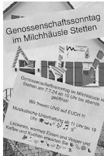
Einladung zum Genossenschaftssonntag