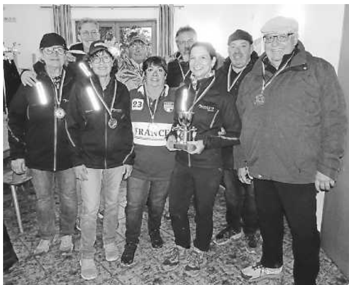
Mehr als die Hälfte der Teilnehmer erhielt eine Medaille