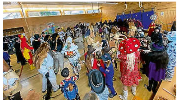
Närrische Zeit mit Hästrägern