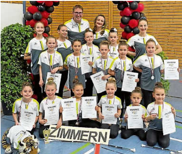
Der BTSC präsentiert stolz die Medaillen und Urkunden

Am vergangenen Wochenende fand in der Eschachhalle in Niedereschach im Rahmen der Baden-Württembergischen Freestyle Meisterschaften des DTSV ein Twirling Talent Contest (kurz TTC) statt. Die Nachwuchstwirlerinnen des BTSC Zimmern konnten dabei erstmalig in Turnieratmosphäre ihre einstudierten Choreographien darbieten. Das Team BTSC Baton Bees zeigte dabei eindrucksvoll, was sie bereits mit dem Stab zu leisten imstande sind und begeisterte das Publikum aus ganz Deutschland mit einer mitreißenden Choreographie.