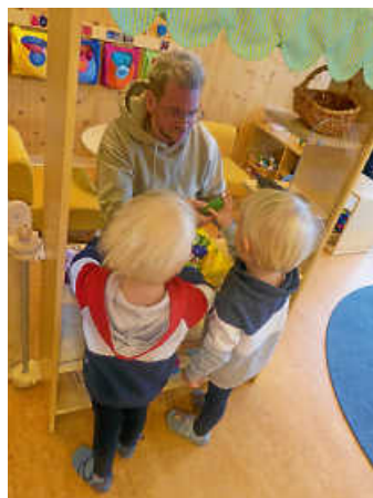
Spielen im Gruppenraum

Zuerst starteten wir gruppenintern mit dem gemeinsamen Morgenkreis. Es wurden traditionell die Kerzen des Adventskranzes angezündet, die Weihnachtsgeschichte erzählt und natürlich gesungen.