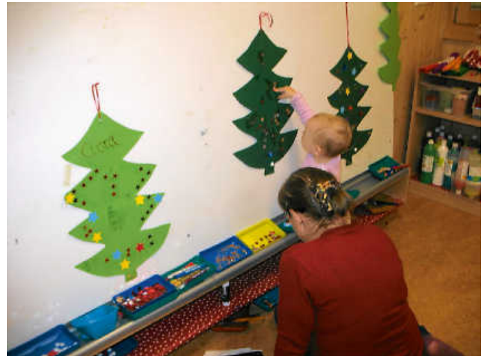
beim Basteln von Tannenbäumen im Atelier

Rundherum war es wieder einmal ein entspannter, wunderschöner Besuchsmorgen.