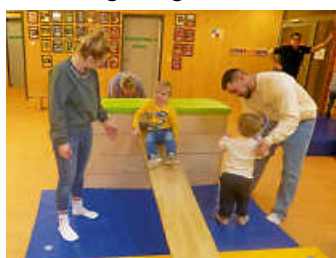
Beim Turnen in der Bewegungshalle

Danach konnten die Kinder mit ihren Begleitern unsere Räume erkunden und kennenlernen.