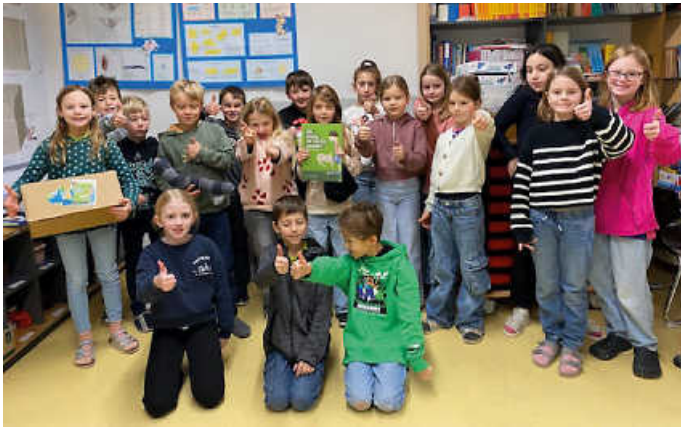
Oma, erzähl mir von der Zukunft

In der Geschichte handelt es sich um den Regenbogenwurm Flori, der seine Farben und Kräfte verloren hat. Zusammen mit Lilli und ihrer Oma macht er sich auf die Reise, um diese wieder zurückzuholen. Dafür müssen sie in besonderen Städten Superkräfte der Zukunft finden: Liebe, Visionen, Mut, Gemeinschaft, Neugier und Kreativität.