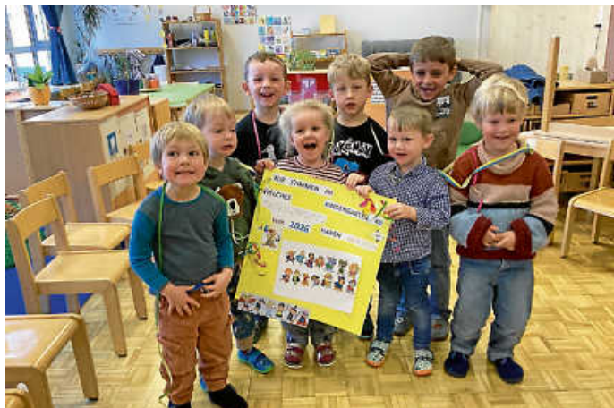
Helden aus Buch und Film

Tor, welches bei uns im Kindergarten aufgebaut ist. Die Kinder achten genau darauf, dass es „8 Uhr schlägt“. Am Donnerstag, 15.01., durften die Kinder im Kindergarten ihr Fasnetsmotto gemeinsam abstimmen. Durch diese Partizipation lassen wir die Kinder demokratisch mitentscheiden und sie übernehmen Verantwortung für das Ergebnis. Dies stärkt besonders bei Kindern die Eigenständigkeit, die sozialen Kompetenzen und das Selbstbewusstsein. Sie haben mit kleinen Legosteinen abgestimmt. Es gab drei Vorschläge: Zootiere, Sportler oder Superhelden. Die meisten Steine lagen bei den „Helden aus Buch und Film“. Einige Kinder zeigten ganz stolz das neue Fasnetsmotto für 2026 auf dem Foto.