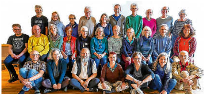
Gemeinschaftstag in Horgen

Am Dienstag, 27.01., laden wir wieder um 19 Uhr ins Gasthaus Sonne Da Semi, Hansjakobstr. 13 in Zimmern o. R. zu unserem Stammtisch ein.