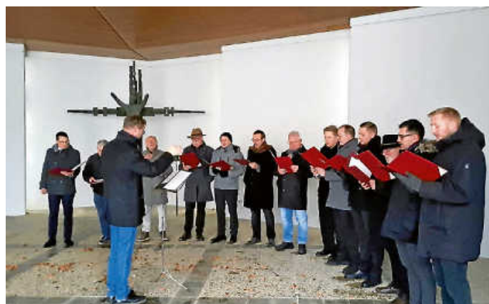
Männerchor an Heiligabend auf dem Friedhof

Traditionell eröffnete der Männerchor des Gesangvereins Liederkrantz Zimmern die Weihnachtstage mit stimmungsvollen Liedern am Nachmittag des Heiligabends auf dem Friedhof in Zimmern. Für zahlreiche Zuhörende begannen mit bekannten Texten und Melodien wie „Oh du gnadenreiche Zeit“ und „Stille Nacht“ die Weihnachtstage in liebevoller Erinnerung an jene, die sie nicht mehr mitfeiern können.