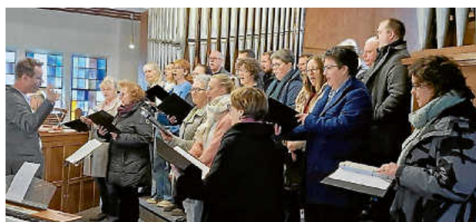
Chor „TaktLos“ beim ökumenischen Gottesdienst