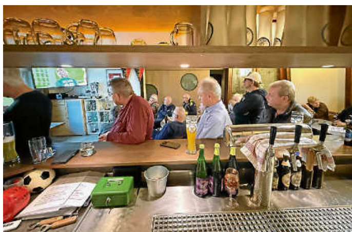
Fußball-Bundesliga – live im Sportheim

Das Sportheimteam freut sich auf zahlreiche Besucher.