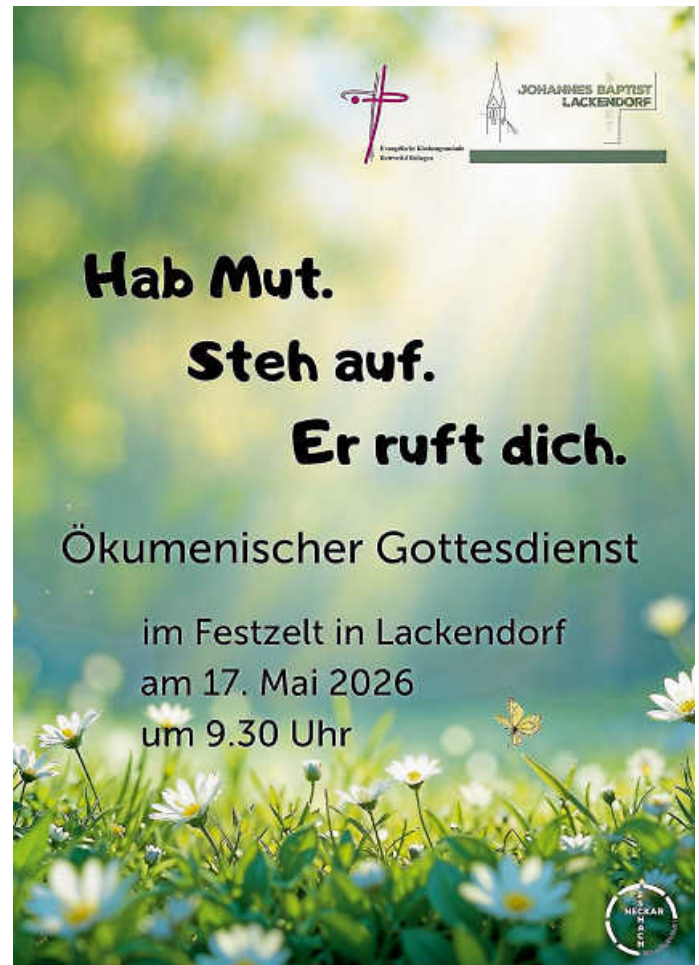
Plakat: Evang. Kirchengemeinde Rottweil-Flözlingen

19.00 Uhr – Herzliche Einladung zur ökumenischen Frauengruppe – Gemeindehaus Charlottenhöhe.