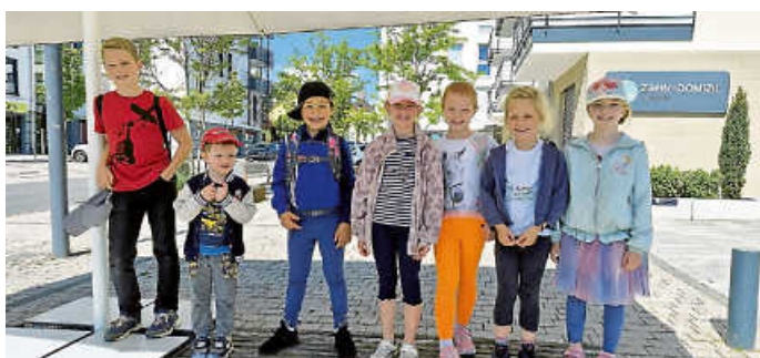
Jetzt geht's los

Ausgeschlafen, in bester Laune und bei strahlendem Sonnenschein waren die Kinder vom Kinderchor SchuKi am Samstag auf ihrer Maiwanderung. Von Zimmerns Dorfplatz ging es nach Hausen zum Grillen.