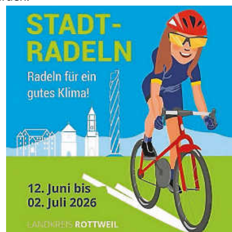
Plakat: Landratsamt Rottweil

Dafür bringt die Initiative Bewegung in Städte, Gemeinden und Unternehmen. Mit Kampagnen, Aktionen und starken Partnern macht sie das Radfahren sichtbar, erlebbar und attraktiv im Alltag. Egal, ob zur Arbeit, zur Schule oder zum Einkaufen: Wer aufs Rad steigt, bewegt nicht nur sich selbst, sondern auch etwas fürs Klima. Wir wollen uns vorwärtsbewegen und gemeinsam in die Gänge kommen: Denn in Baden-Württemberg fahren wir Rad. Weitere Informationen gibt es auf der Website der RadKULTUR.