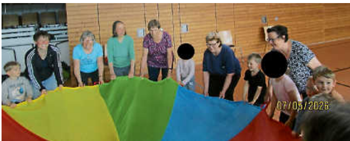
Die Kinder schwingen mit den Senioren gemeinsam das Schwungtuch

Für den Hauptteil der Turnstunde überlegten sich die Erzieherinnen einen Teil. Im großen Kreis und auch zur Musik wurden Bälle herumgegeben und beim Stopp der Musik verschiedene Übungen mit dem Ball gemacht. Danach hielten sich alle Senioren und Kinder an einem großen Schwungtuch fest, machten verschiedene Übungen und erlebten auch hierbei ganz besondere Momente. Für alle Senioren und Kinder war es eine ganz besondere Turnstunde. Gemeinsame wurde gelacht, miteinander geturnt und einzigartige Momente im Miteinander von Senioren und Kindern erlebt.