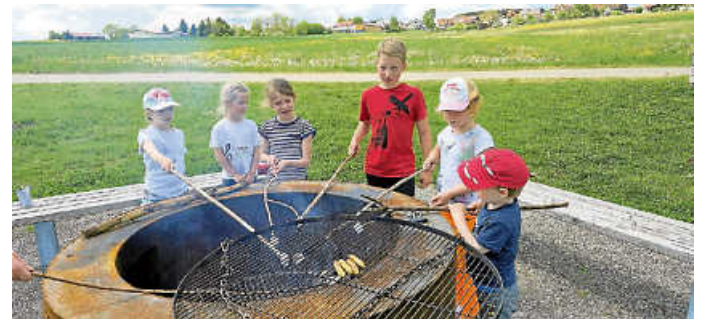
Zum Nachtisch Marshmallows