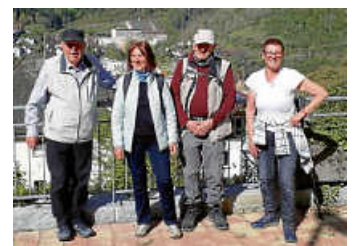
unterwegs auf der kleinen Tour

Bei der Spendenwanderung im vergangenen Jahr wurden für unseren Verein 240 € erwandert, die wir gut für unser Projekt „Öffentlichkeitsarbeit“ verwenden konnten.