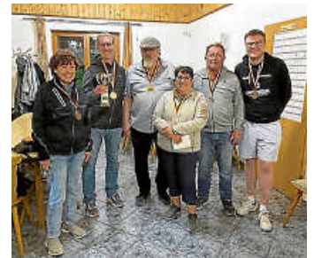
Die Finalisten

Gesangverein Liederkranz e.V. Zimmern o.R.