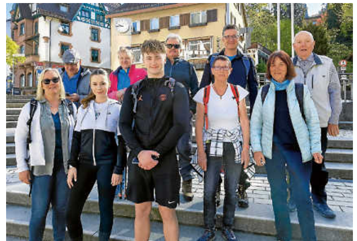
Aufbruchsstimmung - gleich trennen sich die Wege

... ging es bei strahlendem Sonnenschein, besten Wanderbedingungen und mit viel guter Laune für die Wanderlustigen des Vereins rund um Schramberg. „Mit Spaß gutes Geld verdienen“, das war das Ziel für die Teilnehmenden an der Spendenwanderung, die von der Kreissparkasse ausgerichtet wurde.