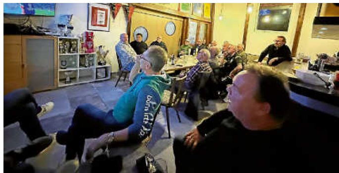
Fußball immer LIVE im Sportheim

Donnerstag, 30.04. und Freitag, 1. Mai, geschlossen .