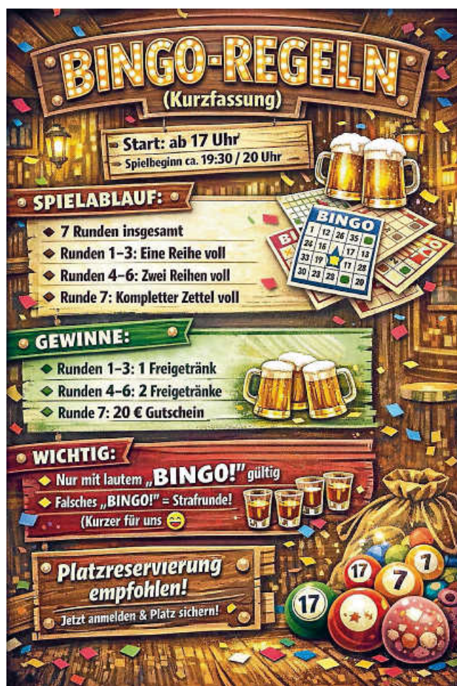
Plakate: Lackendorfer Baronen-Gilde

Im Anschluss findet ein Bingo-Abend mit Möre und Core statt. Die Zunftstube ist ab 17 Uhr geöffnet und dort gibt es bis zum Spielbeginn zu jedem bestellten Getränk einen Bingo-Zettel dazu. Also kommt pünktlich, bestellt fleißig, sammelt so die Zettel und erhöht damit Eure Gewinnchancen. Wir freuen uns auf Euch.