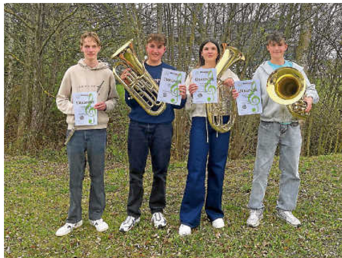
Die erfolgreichen Absolventen der D-Lehrgänge.