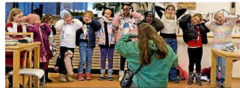
Kinderchor SchuKi 2025