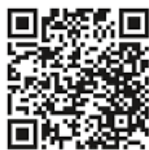
Plakat: Evangelische Kirchengemeinde Rottweil-Flözlingen