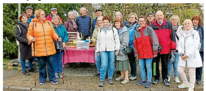
Wanderguppe auf dem Osterweg