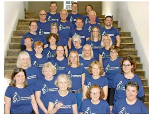
Chor TaktLos 2025