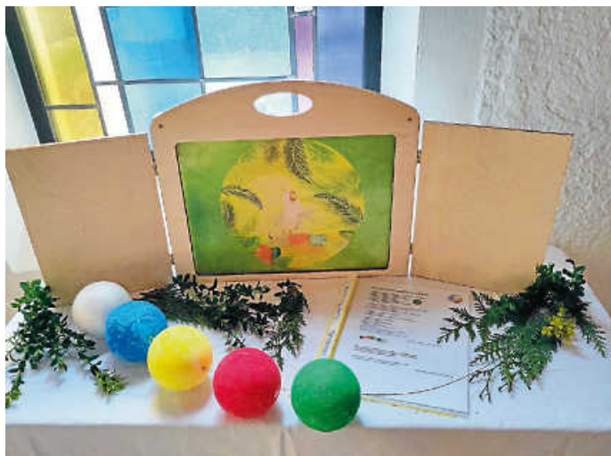
Die grüne Palmsonntagsperle

Perle auch in die Emmauskapelle, wo die Kirchenbesucher ebenfalls an dem Wachsen und der Verwandlung der Raupe teilnehmen können.