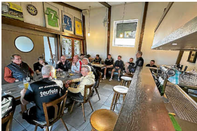
Einladung ins Sportheim

Herzliche Einladung ins Sportheim zu Hirsch-Bier & Wurstsalat Euer SVZ-Sportheimteam