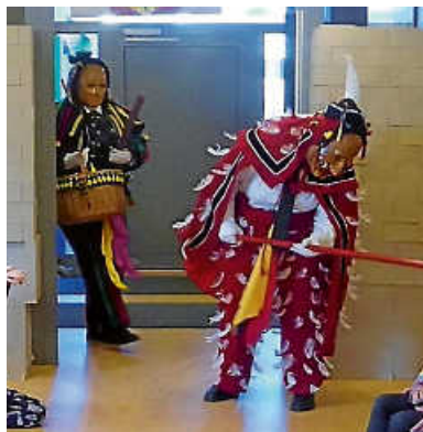
Narrenfigur läuft ein Kommunale Kita Zimmern