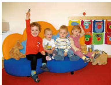
Stolze Krippenkinder Kommunale Kita Zimmern

Wir, die Krippenkinder aus der Kommunalen Kindertagesstätte in Zimmern o. R., möchten uns sehr herzlich bei Herrn Boztepe (Inhaber des Snack-Tempels in Rottweil) für die großzügige Spende bedanken. Die Kinder lieben das bunte, weiche Sofa sehr. Durch die geringe Höhe können selbst die Kleinsten bequem selbstständig auf das Sofa klettern und sich hinsetzen. Wirklich eine tolle Idee und Sache. Viele strahlende Kinderaugen sagen, DANKE.