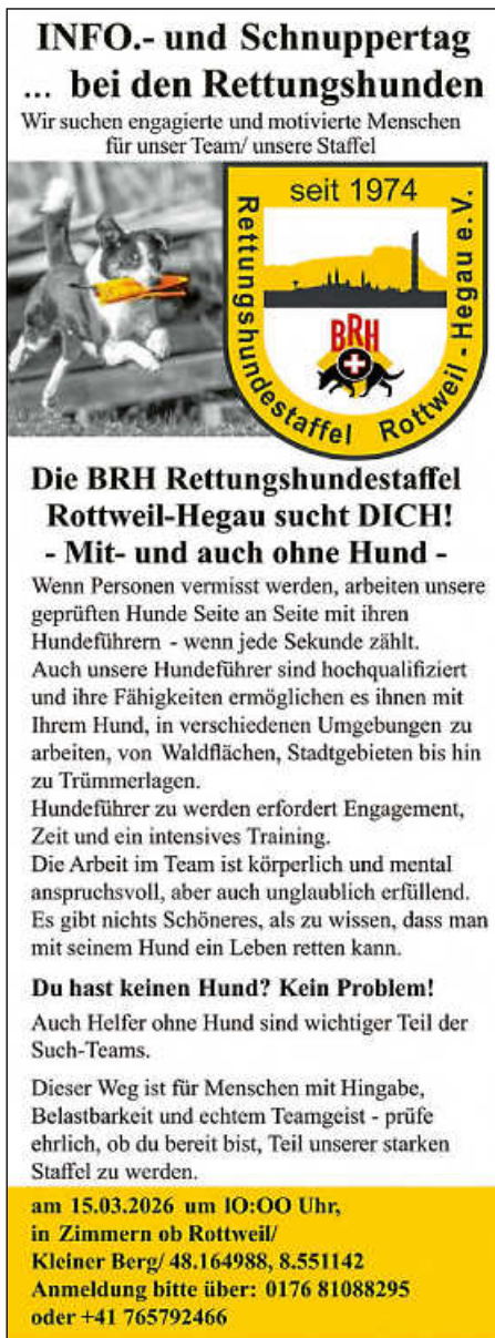
Plakat: BRH Rottweil-Hegau