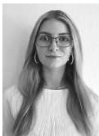
Die junge Dame, die eine Tischtenniskarriere starten möchte.

Die junge Dame, die in Rottweil wohnhaft ist, begeisterte sich schon in jungen Jahren für den Tischtennisport. In den Jahren 2017-2020 startete sie beim TTC Rottweil in den Jugendmannschaften. Im Jahr 2023 entschied sie sich dann, beim TTV Zimmern einen neuen Anlauf zu wagen. Nach mehreren Trainingseinheiten folgte der Vereinswechsel. So kam es ihr gerade recht, als man für die Saison 2024/25 eine neuformierte 3. Mannschaft meldete und sie stellte sich gerne für die neue Mannschaft zur Verfügung. Da sie sich im letzten Jahr für einige Monate im Ausland aufhielt, stand sie nicht regelmäßig zur Verfügung, wenn es aber möglich war, stand sie für den TTVZ an den Tischtennisplatten. Und das möchte sie auch weiterhin beibehalten, da es ihr in diesem Verein recht gut gefällt.