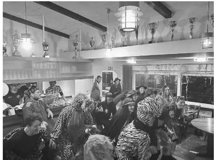
Schmotziger 2024 im Sportheim