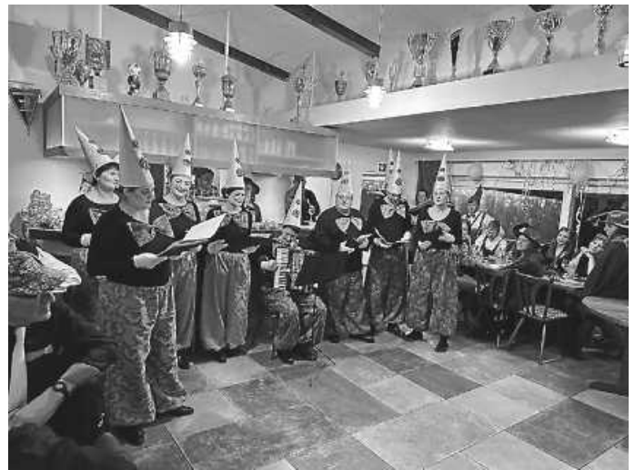
Schmotziger 2024 im Sportheim