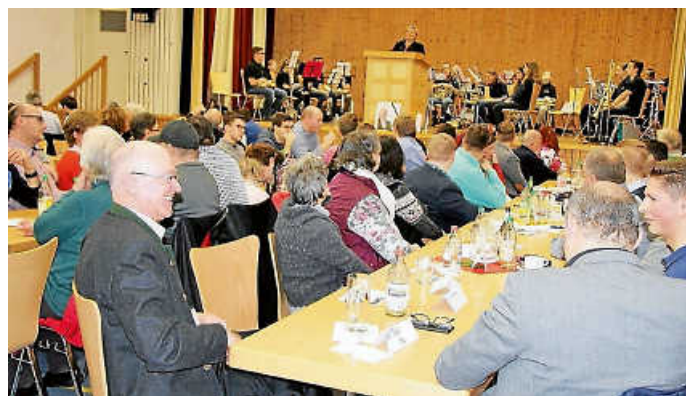
Die JU freut sich über zahlreiche Gäste.