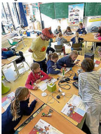
Es wird ausprobiert

Zum Abschluss der Aktion gab es für die neu ausgebildeten Energie-Detektive eine Urkunde sowie wertvolle Energiespartipps für die ganze Familie.