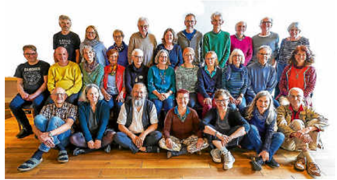
Gemeinschaftstag in Horgen