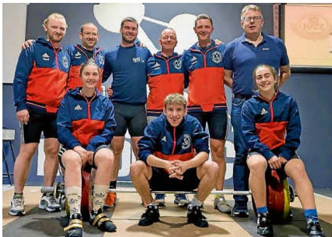
Erfolgreiche Mannschaft in Durlach