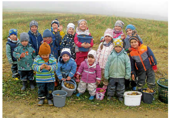
Jedes Kind hat seinen Eimer mit Kartoffeln gefüllt bekommen

Am Schluss haben wir dann noch gemeinsam Kartoffeln für den Kindergarten gesammelt. Manfred hat uns hierfür extra einen großen Korb am Feld bereitgestellt. Im Anschluss sind wir zur Bollhütte gelaufen und haben dort eine Vesperpause eingelegt. Hier hatten die Kinder noch etwas Zeit zum Spielen, bevor sie von Mama oder Papa abgeholt wurden.