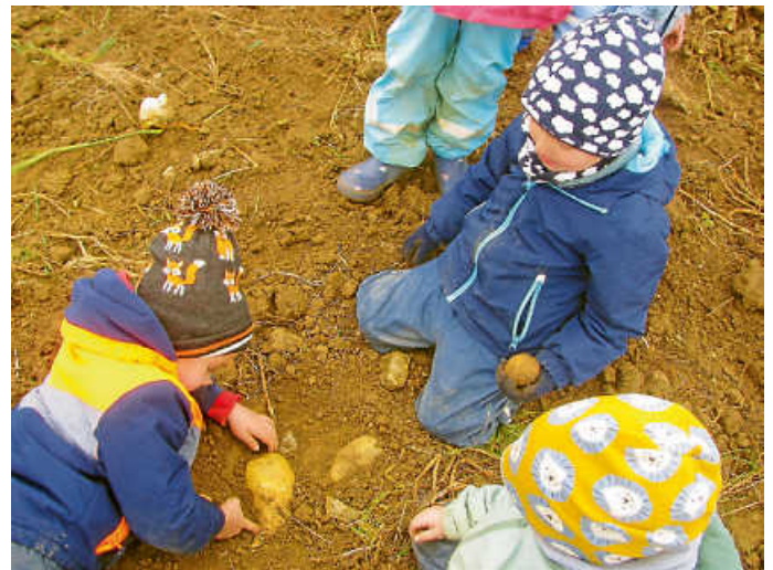
Die Kinder haben zwei riesige Kartoffeln gefunden

Auf dem Kartoffelfeld angekommen, ging es sofort los und die Kinder sammelten viele Kartoffeln in ihren Eimern ein. Eine Kindergruppe konnte sogar am Rande des Feldes zwei riesengroße Kartoffeln entdecken und ausbuddeln.