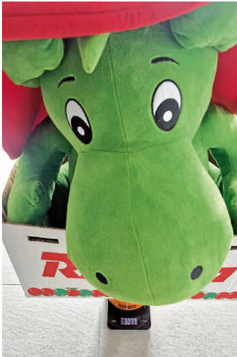
Grisu auf der Waage - 3077 Gramm wiegt er.

Die drei Gewinnerinnen dürfen sich nun über je einen kleinen Plüsch-Grisu und eine Grisu-Tasse freuen. Herzlichen Glückwunsch!