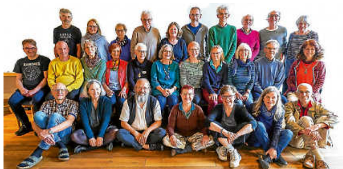
Gemeinschaftstag in Horgen

Sie können uns unverbindlich kennenlernen, Neues vom gemeinschaftlichen Wohnprojekt in der Hausener Straße erfahren (Bauantrag ist gestellt!), Fragen stellen, sich ein Bild machen. Wir freuen uns über Neugierige, Interessierte, Wohnwillige, Unterstützende und auf einen schönen Abend.