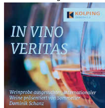
Im Wein liegt Wahrheit teufels