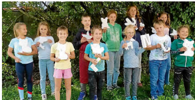
Die Kinder zeigen stolz ihre Werke

Als Fahrgeld werden 5 € einbehalten, den Restbetrag (15 €) bekommen die Teilnehmer zurück.