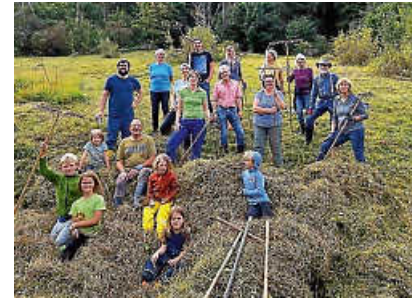
Helfertrupp Gallisried

Der BUND Raum Rottweil lädt ein, zum Erhalt eines besonders wertvollen Biotopes mit anzupacken. Im Eschachtal nordwestlich von Horgen liegt versteckt ein Kleinod mit besonderer Bedeutung für den Natur- und Artenschutz: das Hangquellmoor „Gallisried“. Hangquellmoore sind kleinflächige, aber stark