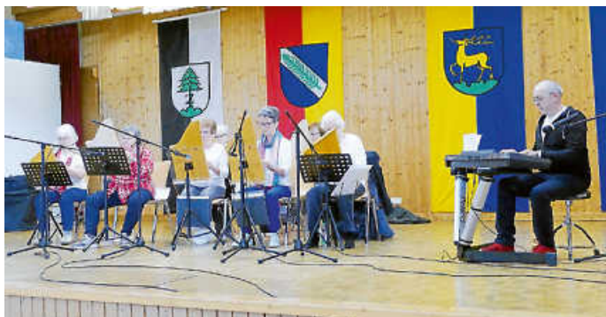
Gruppe beim Auftritt Seniorennachmittag