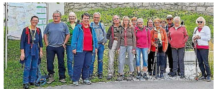
Start zur Sommerwanderung

Bei nicht ganz so sommerlichem, doch glücklicherweise trockenem Wetter machten sich die wanderfreudigen Daheimgebliebenen des Gesangvereins Liederkrantz Zimmern am Samstag, 23. August, auf zur witterungsangepassten Sommerwanderung um den Bettenberg. Nach einem zünftigen Start beim Vorstand des Sängerkranzes Rotenzimmern ging es zunächst entlang der Schlichem und dann weiter zum Weiher bei Böhringen, wo das Wetter zu einer ausgiebigen Pause einlud. Frisch ausgeruht ging es dann durch den Wald bergauf, wo die Wanderer mit einem herrlichen Ausblick belohnt wurden. Vorbei am Bettenberghof führte der Weg zurück zum Ausgangspunkt. Gut gelaunt ließ die Gruppe den Tag im Genießerhof in Dietingen ausklingen.