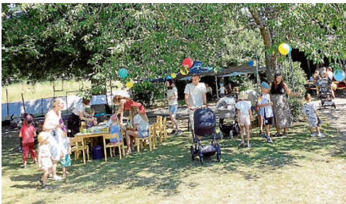
Spaß im Garten