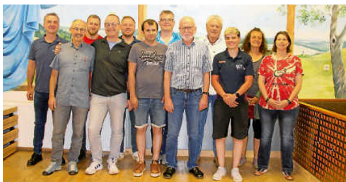
Die gewählten Ausschuss-Mitglieder