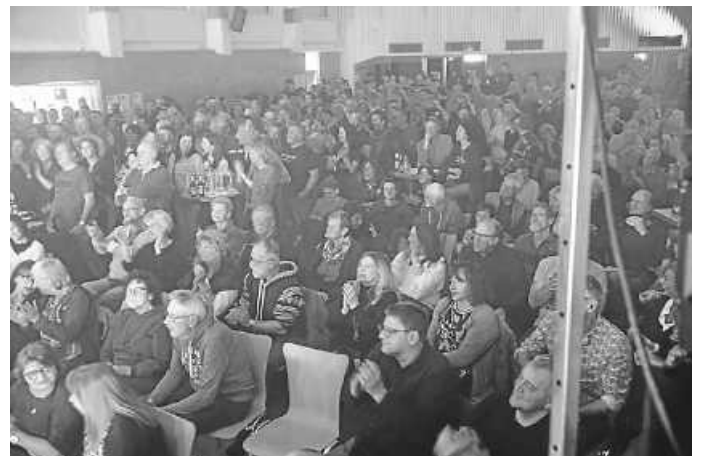
Tolle Atmosphäre in voller Halle