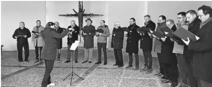
Männerchor auf dem Friedhof