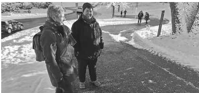
Sonne pur aber kalt

Bilderbuchwetter mit einer herrlichen Schneelandschaft wie schon lange nicht mehr hatten die Wanderer.