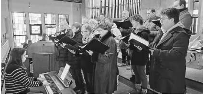
Musikalische Umrahmung am 2. Weihnachtsfeiertag