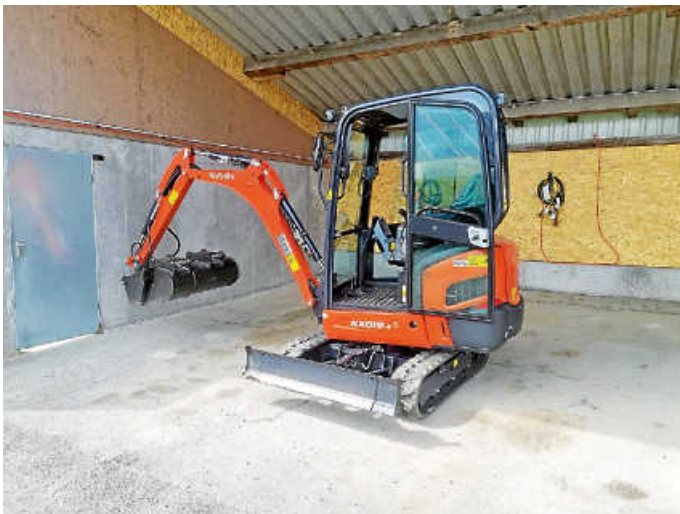
neuer Bagger für das Bauhof-Team

Der Arbeitskreis „Bauhof“, bestehend aus Mitgliedern des Gemeinderates und des Bauhofes, hatte sich für die Beschaffung des Baggers entschieden. Der Bagger wurde vom Gemeinderat für das Haushaltsjahr 2025 eingeplant.