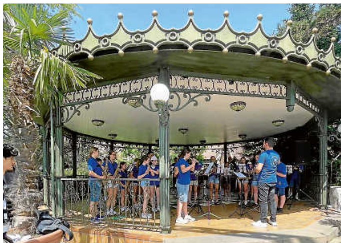
Euro Musique Festival

Die einzigartige Verbindung aus musikalischen Darbietungen und Freizeitpark-Erlebnissen machte den Tag zu einem unvergesslichen Ereignis für alle Beteiligten. Ein Mega-Event mit schönen Erinnerungen an die JUKA-Zeit!