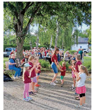
Die jüngsten Teilnehmer

Die Trachtler präsentierten ihre Tänze unter blauem Himmel und konnten so manchen Besucher zum Mittanzen animieren. Für kühle Getränke und ein kleines Vesper war gesorgt. Bis zum Einbruch der Dämmerung genossen alle den Abend in geselliger Runde.