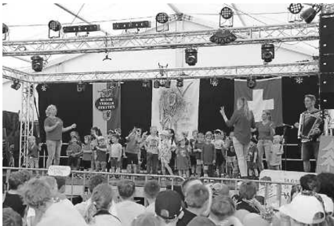
Hey, Pippi Langstrumpf