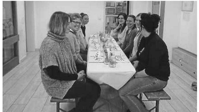
Die Mamas sitzen am schön gedeckten Tisch

Nachdem die Mamas am hübsch verzierten Tisch Platz genommen haben, wurden sie von ihren Kindern rundum versorgt und bedient. Getränke wurden gereicht, die Vorspeise und der Hauptgang serviert. Das Ganze wurde mit einem süßen Nachtisch abgerundet.