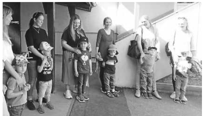
Im Abschlusskreis überraschen die Kinder ihre Mamas mit einem Lied

Verabschiedet wurden die Mamas noch mit einem Abschiedslied. Nicht nur der kulinarische Genuss war für sie etwas Besonderes, sondern dass sich ihre Kinder auf diese wunderschöne, herzliche und unvergessliche Art und Weise bei ihnen bedanken!