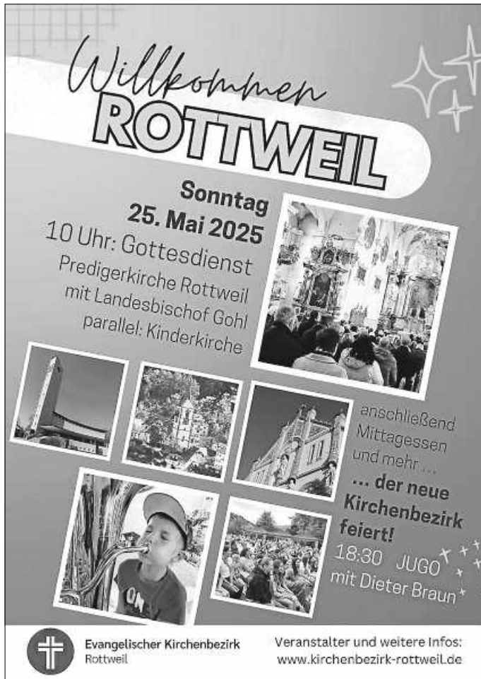
Plakat: Kirchenbezirk Rottweil