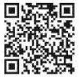
Zur Spendenseite

Hat jemand für uns gespendet, ohne zu wandern? „Unsere“ Wanderer haben für einen finanziellen Grundstock gesorgt. Wie viele Spendengelder wir letztendlich erhalten werden, bleibt abzuwarten. Am 18. Juni ist die Bekanntgabe. Wenn Sie uns noch unterstützen möchten, aber den Wandertag verpasst haben, können Sie dies hier tun.