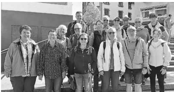
... motivierte Wanderer

Mit guter Laune und leichtem Schritt waren am vergangenen Sonntag Mitglieder des Gesangvereins mit Angehörigen und Freunden in und um Schramberg unterwegs, um die dringend benötigten Spendengelder für einen zeitgemäßen digitalen Auftritt des Vereins zu erwandern.