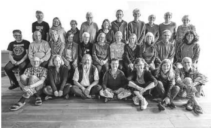
Gemeinschaftstag in Horgen

Am Dienstag, 27.05., laden wir wieder auf 19 Uhr ins Gasthaus Sonne Da Semi, Hansjakobstr. 13 in Zimmern o. R. zu unserem Stammtisch ein.