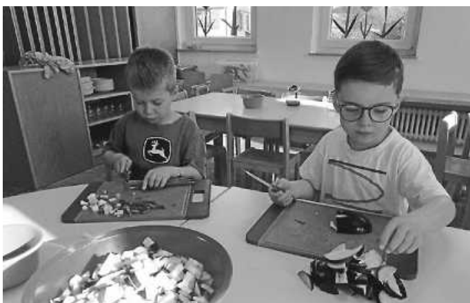
Die Kinder sind fleißig am Gemüse schneiden für das Essen ihrer Mamas

Um einen unvergesslichen Mittag für die Mamas zu veranstalten, machten sich die Kinder mit Feuereifer und Herzblut ans Werk. Tischdekorationen in Form von Herzgirlanden und mit Herzen beklebte Windlichter wurden gebastelt. Eine besondere Einladung für die Mamas rundete das Ganze noch ab. Zu viel wurde darin nicht verraten, nur dass die Kinder ihre Mamas zum Essen einladen wollen.