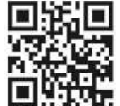
QR Spendenwanderung

Drei Touren mit unterschiedlicher Länge (12,1 km, 9,9 km und 7,6 km) stehen zur Auswahl, der Start ist in Schramberg, die Startzeit flexibel zwischen 9 Uhr und 10.30 Uhr. Alle Infos zu den Touren findet ihr hier: