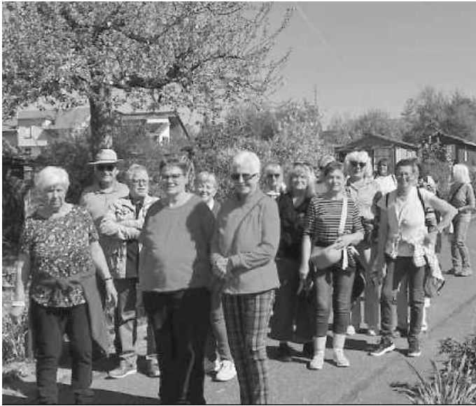
Spaziergruppe Zimmern Ende April