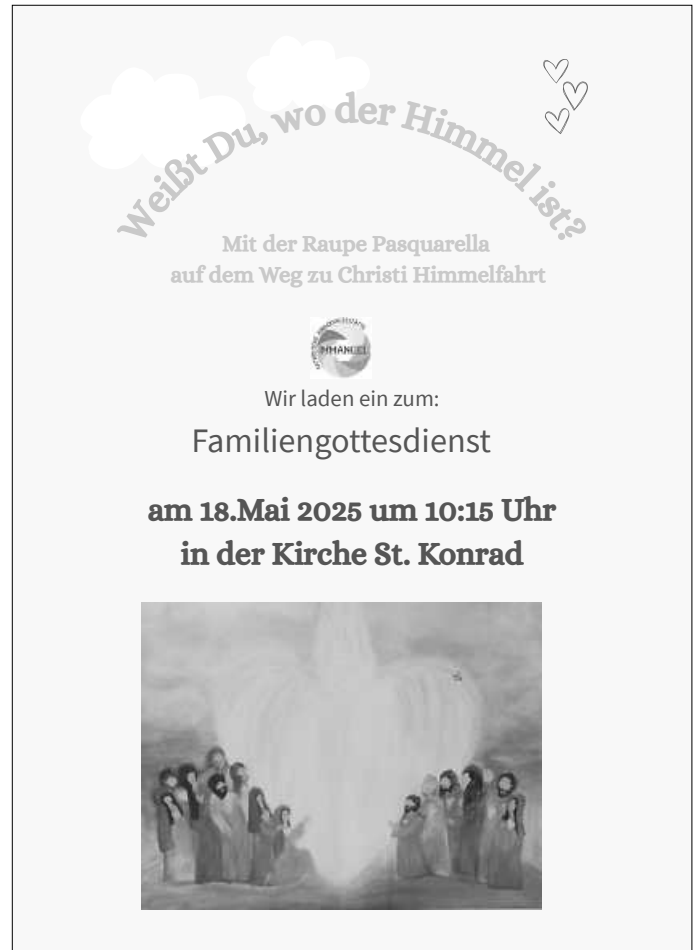
Plakat: Kita Immanuel