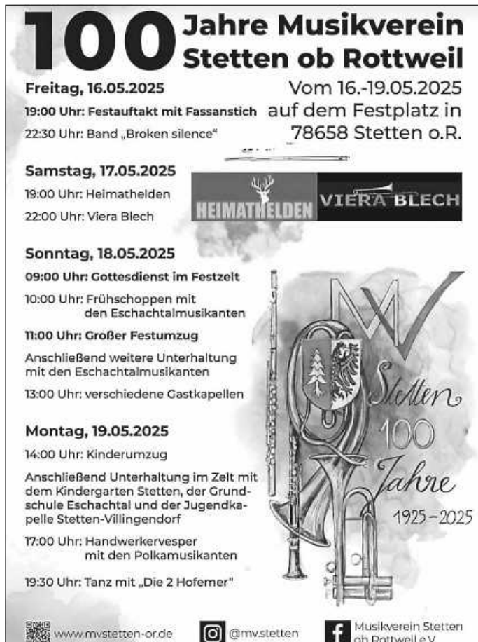
Plakat: MV Stetten

Wenn möglich, lassen Sie also das Auto stehen und schauen sich unsere Umzüge an! Wir freuen uns auf Sie.