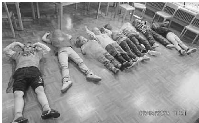
Die Kinder stellen einen Regenbogen dar

Auf „Otto“ freuen sich die Kinder immer sehr, da er immer zu jedem Thema eine Idee hat oder gemeinsam mit den Kindern ihren alltäglichen Forscherfragen nachgeht und versucht, diese auf kindliche Art zu erforschen und zu erklären. Mit tollen Experimenten und theaterpädagogischen Impulsen versucht er den Kindern die Natur und die Welt ein Stückchen näherzubringen. Aktuell beschäftigen sich die Kinder aus der Gelben Gruppe mit dem Thema „Wetter im Frühling“.