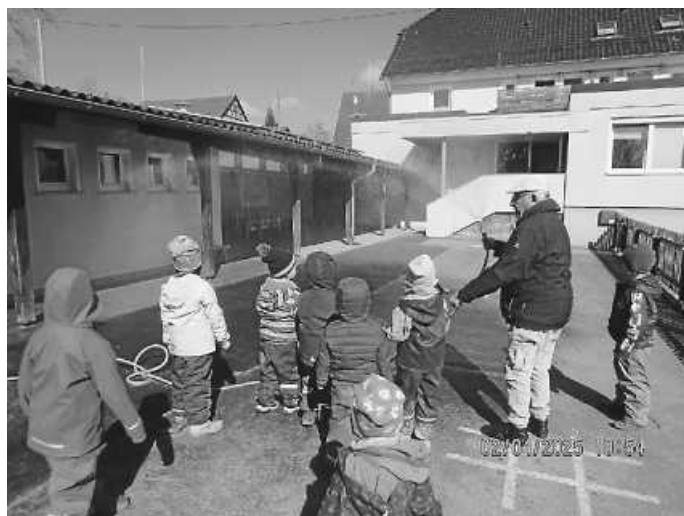
Die Kinder sehen, wie ein Regenbogen entsteht

Natürlich fanden die Kinder auch noch heraus, was es alles braucht, damit in echt ein Regenbogen entsteht. Das Wetter spielte mit und es schien die Sonne, so sind die Kinder mit Otto gemeinsam in den Garten und haben den Gartenschlauch genommen, das Wasser eingestellt und in die Sonne gehalten. Auch hier konnten sie einen tollen Regenbogen sehen. Die Kinder konnten hierbei lernen, dass es die Sonne und den Regen braucht, damit man am Himmel einen Regenbogen sehen kann.