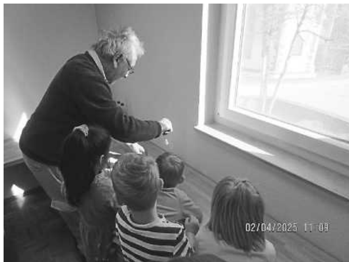
Die Regenbogenfarben werden gefiltert

Im Anschluss konnten sie selbst ausprobieren, wie man einen Regenbogen ganz leicht nachmachen kann – indem man einen durchsichtigen Glasbaustein ins Licht hält und somit sieht, wie die einzelnen Farben daraus an die Wand gefiltert werden.