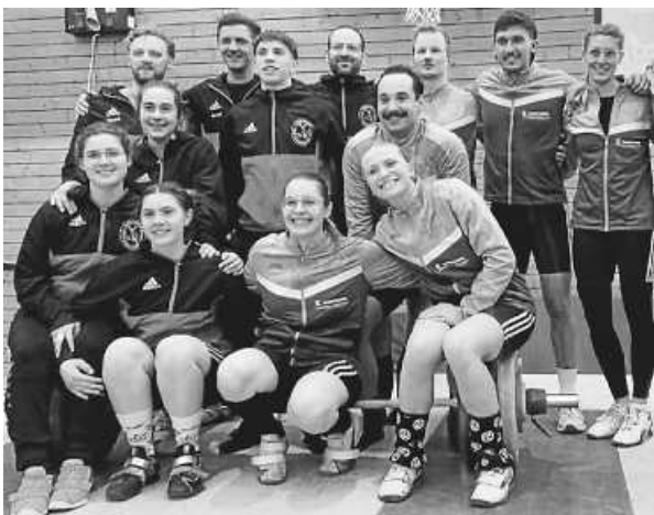
Athletinnen und Athleten des SV Flözlingen und KSV Durlach

Am Samstag, 29. März, kann es zu einer Vorentscheidung im Titelrennen kommen.