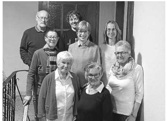
Wiedergewählte und neugewählte Schriftführerin und Ehrenmitglieder