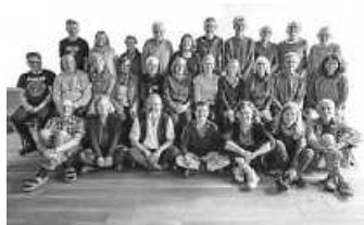
Gemeinschaftstag in Horgen

Sie können uns unverbindlich kennenlernen, Neues vom gemeinschaftlichen Wohnprojekt in der Hauseener Straße erfahren, Fragen stellen, sich ein Bild machen. Wir freuen uns über Neugierige, Interessierte, Wohnwillige, Unterstützende und auf einen schönen Abend.