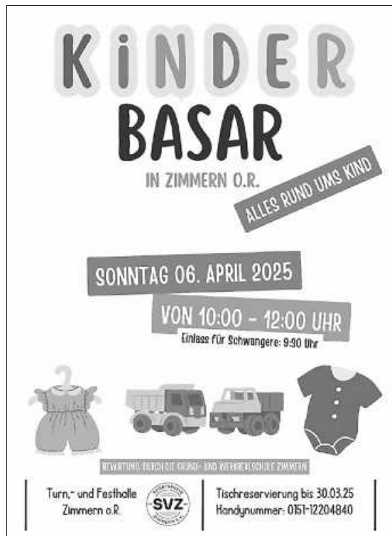
Plakat: Sparte Turnen

Wir, von der Sparte Turnen, freuen uns, den diesjährigen Kinder Basar zu organisieren und freuen uns zum einen über viele Verkäufer, die Interesse haben, ihren Kindersachen ein neues Zuhause zu geben, aber freuen uns natürlich auch über viele interessierte Besucher. Eine Tischreservierung ist bis zum 30.03. möglich unter Tel. 0151-12204840. Weitere Infos erhalten die Verkäufer im Anschluss an die Anmeldung.