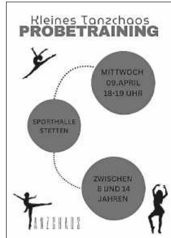
Kleines Tanzchaos Probetraining