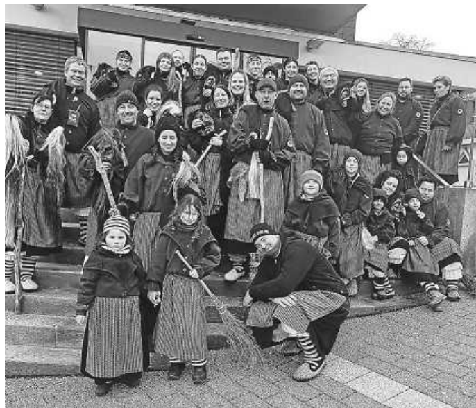
Fasnetmontag – Umzug in St. Georgen