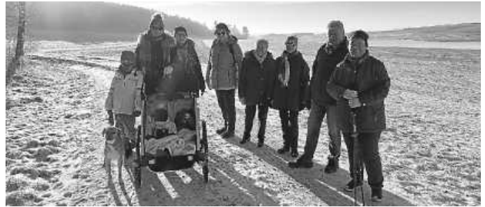
Die Wanderer mit Kindern und Hund

Winterwanderung Obst- und Gartenbauverein Zimmern Tradition ist die Winterwanderung im Januar.