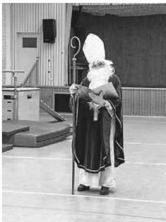
Hoher Besuch in der Turnhalle