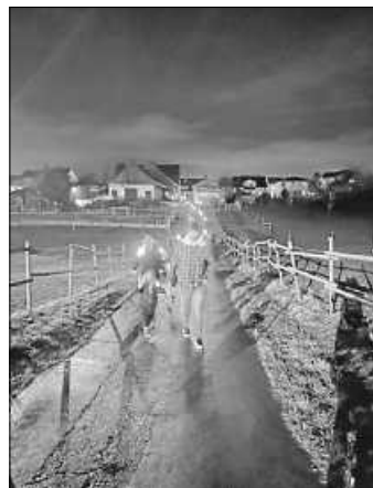
Fackelzug mit ca. 100 Personen durch Zimmern

Zu guter Letzt haben wir uns am 15.12. noch zwei Spezialisten in die Turnhalle eingeladen und haben im Zuge einer Fortbildung viel Neues gelernt und ganz viel Motivation und neue Ideen mitgenommen, um das Kinderturnen noch ideenreicher zu gestalten.