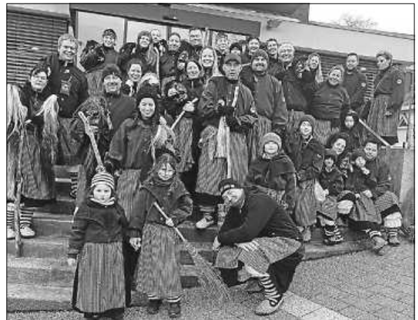
Fasnetmontag - Umzug in St. Georgen