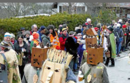
Zapfenmale Umsprung in Horgen