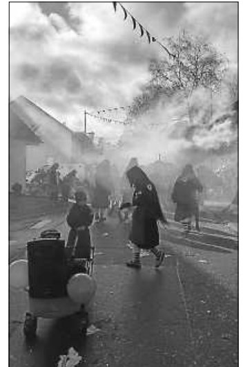
Fasnetsonntag - Umzug in Fischbach

Darauf ein dreifach-kräftiges Stumpen-Hexen .