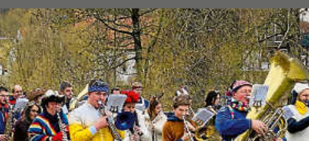
Umzug aus Kindergar- tenkindern und Eltern in Stetten