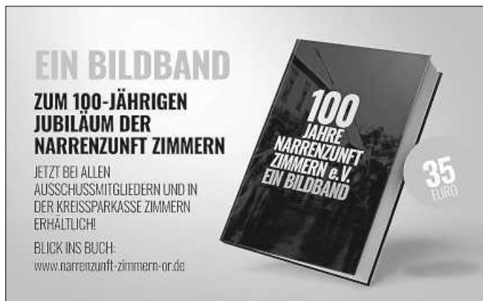
Bildband 100 Jahre Narrenzunft Zimmern