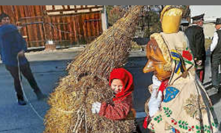
Schraubärumzug in Flözlingen