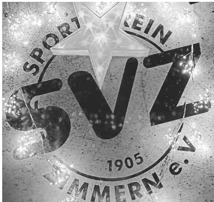
Frohe Weihnachten 2024

Eine besinnliche Weihnacht, ein zufriedenes Nachdenken über das vergangene Jahr 2024, ganz viel Glauben an das Morgen und Hoffnung für die Zukunft wünschen wir allen Ehrenmitgliedern, Mitgliedern, Freunden und der ganzen Zimmerner Bevölkerung von ganzem Herzen.