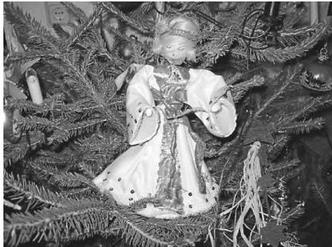
Weihnachts- und Neujahrsgrüße

Die Vorstandschafft wünscht allen Mitgliedern und Freunden des Vereins eine gesegnete Weihnacht und ein gesundes, glückliches neues Jahr.