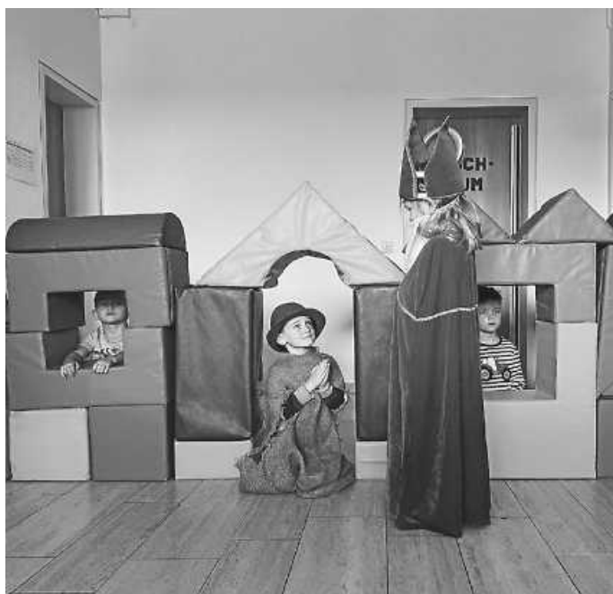
Die Kinder beim Spielen der Nikolausgeschichte