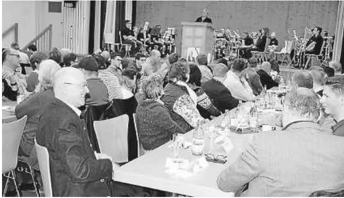
Die JU Zimmern freut sich über zahlreichen Besuch