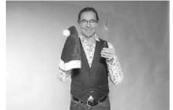
CHAKOs GOSCHpel-Show in Hockenheim

Teilnahme unter: https://nussbaumclub.net/chako-hockenheim/