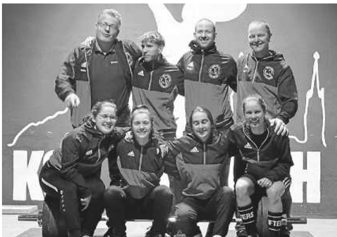
Team mit Betreuer