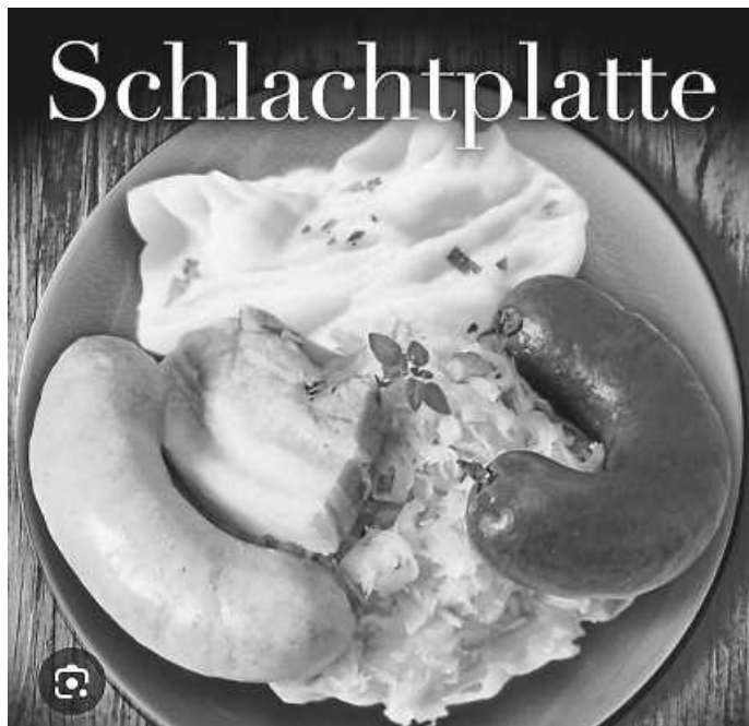
Heiners Schlachtplatte im Sportheim