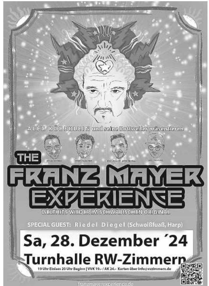
Schwabenrock in der Zimmerer Halle

Karten für 19 Euro unter info@svzimmern.de oder WhatsApp: 0171-1739212 bestellen.