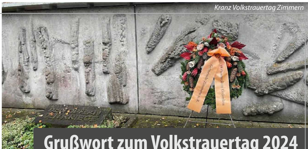
Kranz Volkstrauertag Zimmern