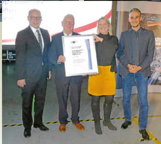
Übergabe Urkunde IHK