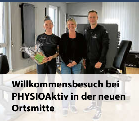
Willkommensbesuch bei PHYSIOAktiv in der neuen Ortsmitte