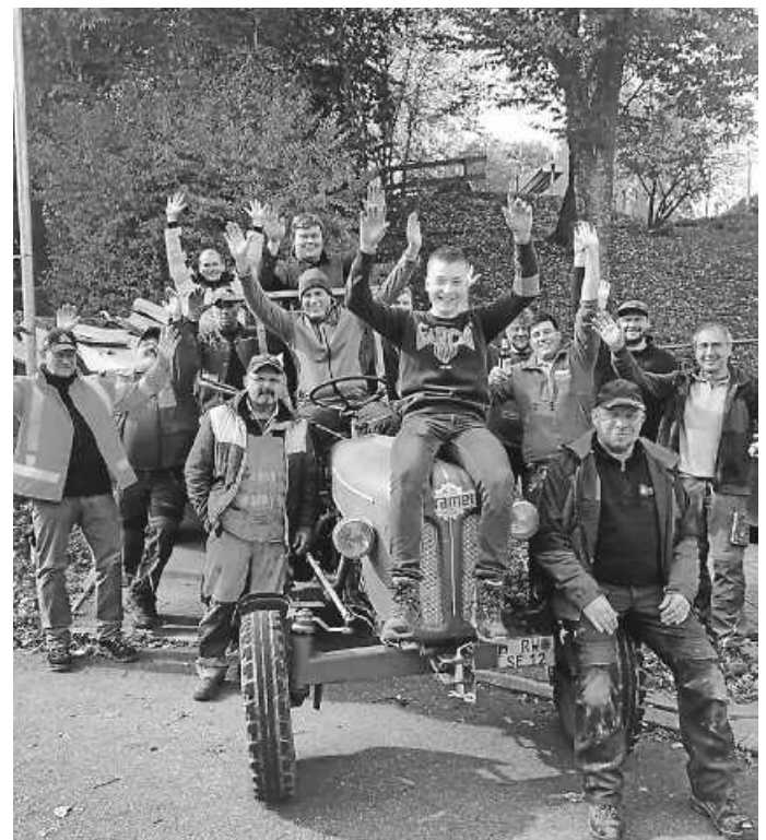
Die fleißigen Helfer des MV Flözlingen