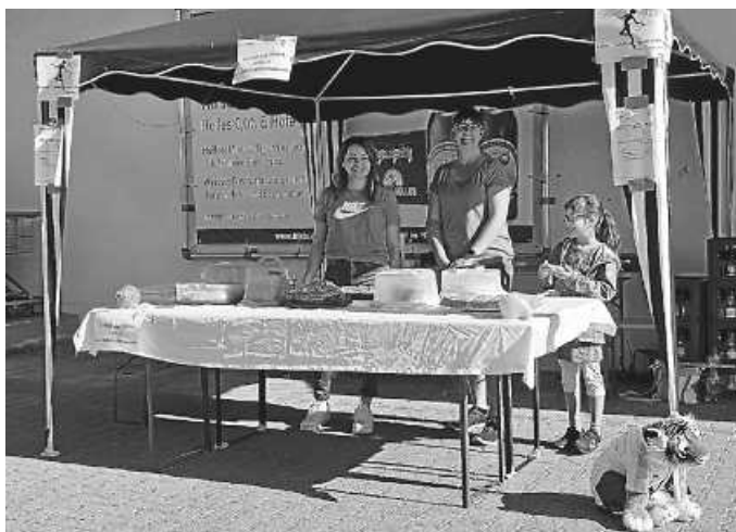
Kuchenverkauf des BTSC am Frito Getränkemarkt

Wann: Samstag, 12.10., 11:30 bis ca. 17 Uhr Wo: Vor dem Frito Getränkemarkt