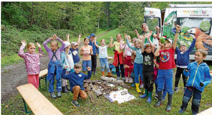
Zimmerner Kinder erkunden den Wald beim Ferienprogramm FeZi

Spaß und Spannung erlebten Kinder aus Zimmern beim Waldtag im Rahmen des Ferienprogrammes FeZi.