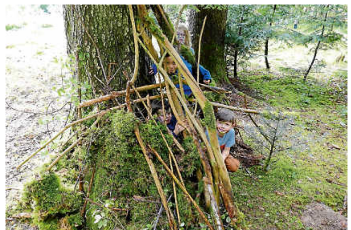
tolle Räuber-Verstecke wurden gebaut