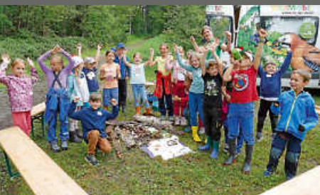
FeZi: Kleine Räuber erkunden den Zimmerner Wald