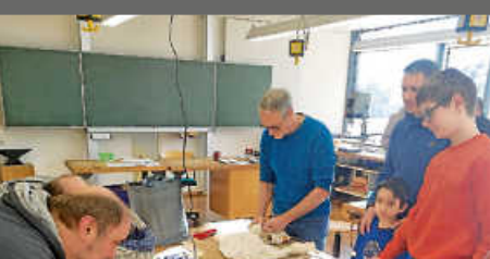
Reparaturcafé am Sa., 14. September in der Grund- und Werkrealschule Zimmern