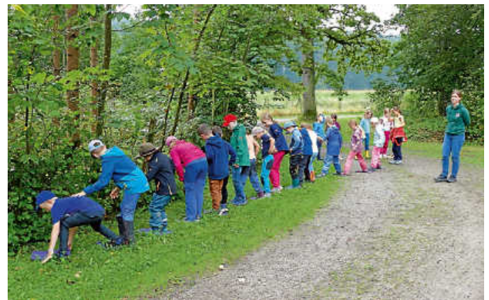
Überquerung des großen Flusses

auch diese Prüfung gemeinsam bewältigt wurde und alle sich erfolgreich verstecken konnten. Zum Abschluss erhielten alle eine Urkunde, die den Kindern bescheinigte, dass sie nun alle Prüfungen des kleinen Räuber-Einmaleins bestanden hatten.