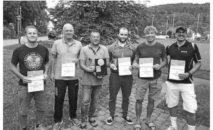
Die Siegerehrung: (von links) Schubnell/Friede (Rottweil), Winter/Schrödl (TTVZ), F.Müller/Hauser (Aistaig).