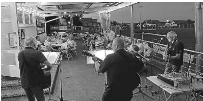
Forever-Young-Band vor dem SVZ-Sporthelm

(Herzlichen Glückwunsch natürlich auch den jungen Nachwuchskickern des SVZ: „SVZ-Fußball-Freunde“ zum tollen 2. Platz)