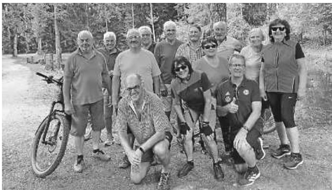
Die Gruppe bei ihrer letzten Tour mit Zwischenstopp bei dem Fischweiher in Seedorf

Neue Teilnehmer sind jederzeit herzlich willkommen.