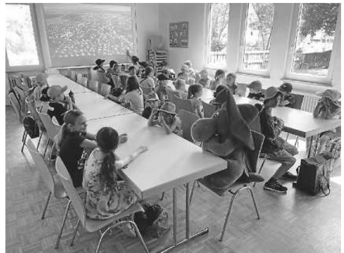
Ein volles Haus bei der Feuerwehr