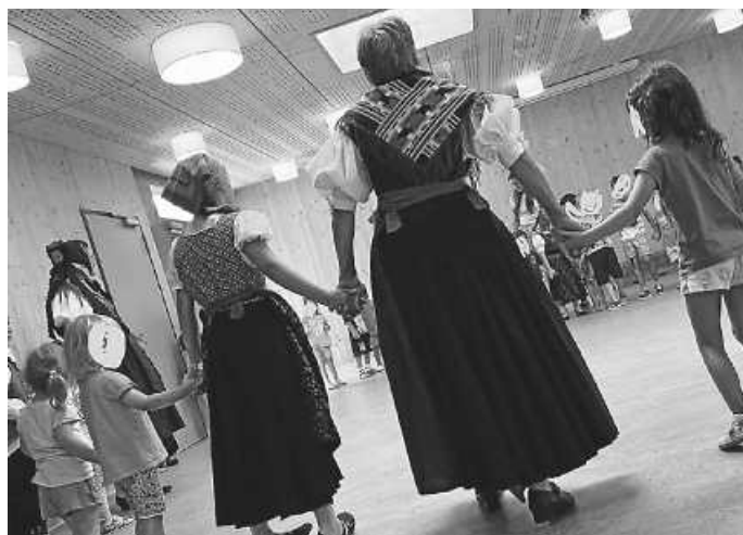
KiGa-Kinder und Trachtler schwingen gemeinsam das Tanzbein

Letzte Woche besuchten Kinder und Aktive des Trachtenvereins die Kita Immanuel und den kommunalen Kindergarten in Zimmern. Zuerst wurden die verschiedenen Teile der Tracht erklärt und die Kinder durften die verschiedenen Kleidungsstücke anschauen und anfassen. Sogar eine hundert Jahre alte Schappel konnten die Kinder bestaunen. Danach wurde das Tanzbein geschwungen und auch die Kitakinder konnten die Trachtentänze einmal ausprobieren. Alle Beteiligten hatten viel Spaß und hoffen auf ein Wiedersehen.