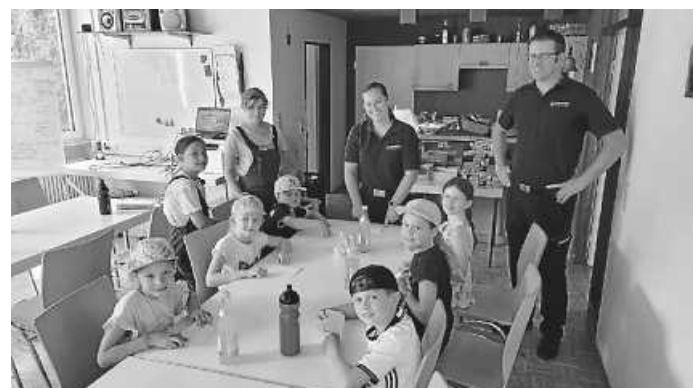
Beim Bootle falten

Am Freitag, den 30. August 2024, fand in Stetten das Ferienprogramm der Feuerwehr Zimmern o.R. statt, bei dem rund 25 Kinder einen spannenden Einblick in die Arbeit der Feuerwehr erhielten. Der Tag begann mit einem Überblick über die Aufgaben der Feuerwehr. Besonders hervorgehoben wurde die Zuständigkeit der Abteilung Stetten für die „Wasserförderung über lange Wegstrecken“ und die „Wasserrettung“. Diese Aufgaben sind in der Gemeinde von besonderer Bedeutung, da die Feuerwehr bei Bränden oft Wasser über weite Strecken heranzuführen muss und bei Notfällen auf den umliegenden Gewässern schnell eingreifen kann.