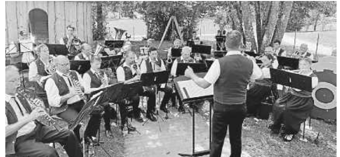
MV Flözlingen beim Auftritt beim Trachtendorfhook

Am vergangenen Sonntag , 01.09. spielten wir am Trachtendorfhook auf dem Parkplatz neben der Turn- und Festhalle in Flözlingen. Bei bestem Wetter unterhielten wir alle Besucher über das Mittagessen hinweg musikalisch.