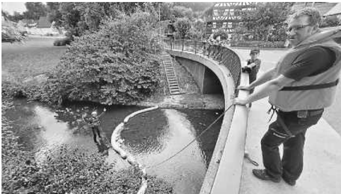
Die Boote werden auf der Eschach auf „Seetüchtigkeit“ geprüft

Besonders der neu gelieferte Gerätewagen Transport, kurz GW-T, zog die Aufmerksamkeit der Kinder auf sich. Das moderne Fahrzeug, das erst in naher Zukunft in den Dienst gestellt wird, ist mit spezieller Ausrüstung für den Transport von Material und Geräten ausgestattet. Die Kinder durften alle Fahrzeuge besichtigen und bekamen erklärt, welche Werkzeuge und Geräte für die verschiedenen Einsätze benötigt werden. Der kreative Teil des Tages bestand darin, kleine Boote aus Papier zu basteln. Diese wurden später an der Eschach auf ihre Seetüchtigkeit geprüft. Es herrschte große Aufregung, als die Boote in das Wasser gesetzt wurden, tapfer die Strömung überstanden. Auch der Spaß kam nicht zu kurz: Mit einem Strahlrohr durften die Kinder Pylonen umschleichen und so selbst einmal die Kraft der Feuerwehrentechnik erleben. Dabei hatten sie sichtlich Freude, während sie versuchten, mit dem kräftigen Wasserstrahl die Hindernisse umzuwerfen.