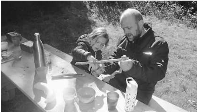
Neue Kreationen ausprobieren