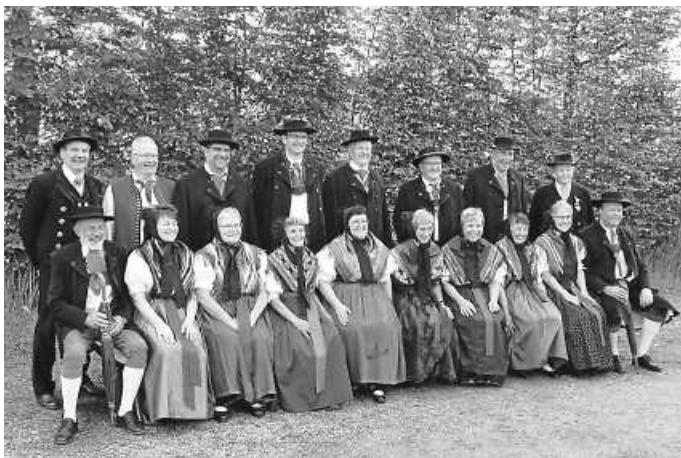
Trachtengruppe mit Vorstand und Ehrenvorstand Gebensbach

Der Trachtenverein Gebensbach, der 1991 zum Weltkulturerbe ernannt wurde, wird im Herbst beim Erntedankfest und der gleichzeitig stattfindenden Feier zum 70-jährigen Vereinsjubiläum ihren Gegenbesuch leisten. Ein Auftritt, auf welchen man sich heute schon freuen kann.