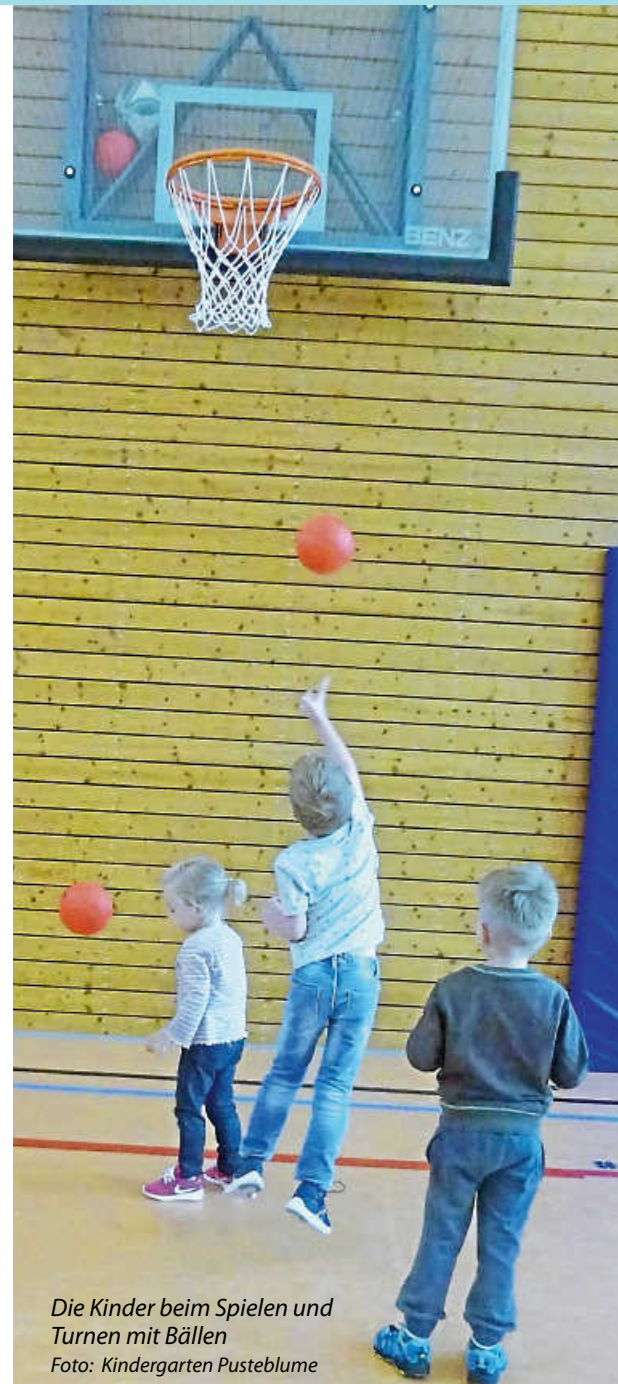
Die Kinder beim Spielen und Turnen mit Bällen

Mit der Geschichte von dem Drachen „Draki“ werden die Kinder altersentsprechend abgeholt und durch die verschiedenen Übungen und Spiele des Bewegungspasses begleitet. Am Ende der Kindergartenzeit bekommen die Kinder eine Urkunde vom Gesundheitsamt Rottweil, wenn sie die Übungen erfolgreich gemeistert haben. Im Vordergrund stehen aber dennoch der Spaß und die Freude an der Bewegung, was durch den Bewegungspass somit noch mehr gefördert werden soll.