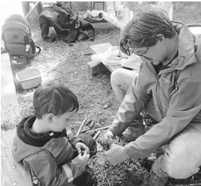
Miteinander ein Andenken gestalten