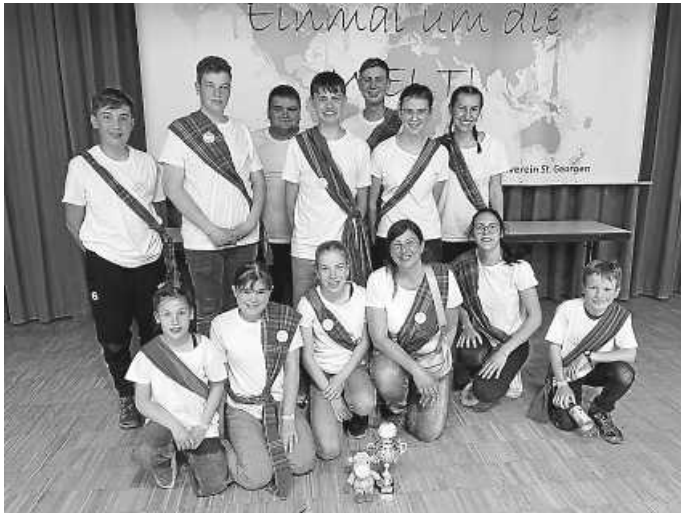
Trachtenjugend mit Betreuern

Die Trachtenjugend hatte ein tolles Wochenende mit vielen schönen Erlebnissen und konnte bei der Lagerolympiade den stolzen zweiten Platz erreichen.