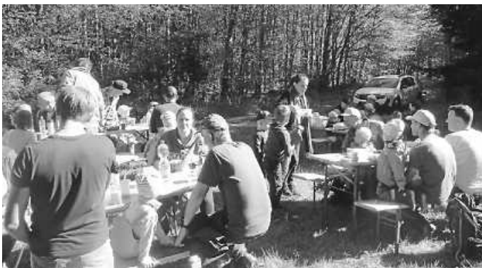
Stärkung beim gemeinsamen Vesper

... auch viele glückliche Kindergesichter.