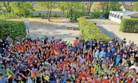
Grund- und Werkrealschule Zimmern – Dorfputzete 2024