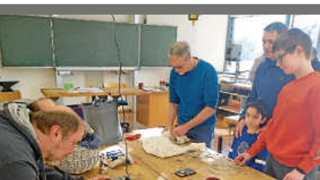
Reparaturcafé am Sa., 11. Mai in der Grund- und Werkreal- schule Zimmern