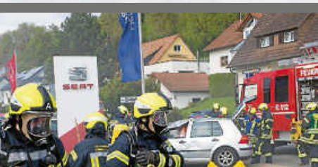
Erfolgreiche Gesamtwehr- übung: Feuerwehr Zimmern führt realitätsnahe Übung bei Autowelt Schuler in Horgen durch