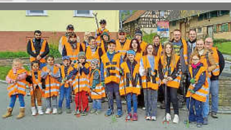
Dorfputzete 2024 im OT Flözlingen