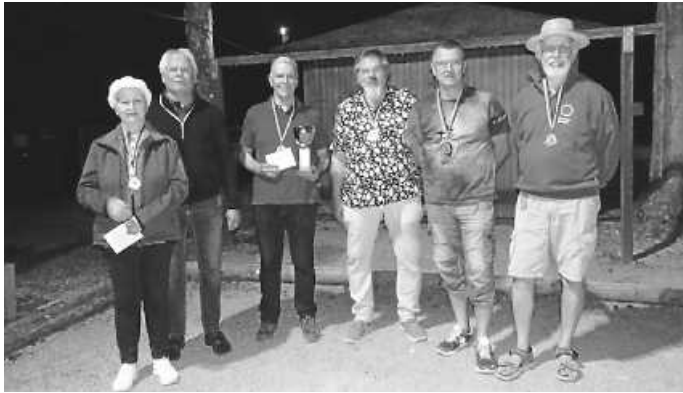
Von links nach rechts: 2. Platz – 1. Platz – 3. Platz

den: Ein zu kraftvoller Wurf seitens ihrer Gegner schleuderte das Cochonnet über die Aus-Linie und bescherte ihnen für ihre noch ungespielten Kugeln 4 Punkte.