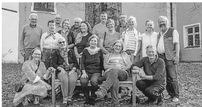
Ausflug zum Schloss Blumenthal

Zeit für Informationen, Fragen und Antworten für neue Interessierte, Förderer, Investitionswillige und Nachbarn zu unserem gemeinschaftlichen Wohnprojekt in der Hausener Straße und zur Genossenschaft „Wohnprojekt De Novali eG“. In lockerer Atmosphäre können Sie uns im Gespräch und beim Austausch kennenlernen. Kommen Sie einfach vorbei. Wir freuen uns!