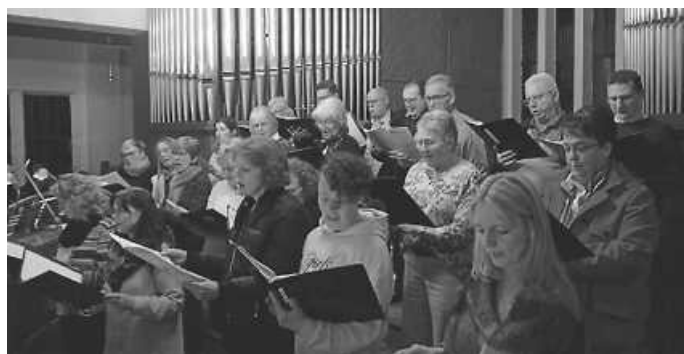
Impression des Gedenkgottesdienstes