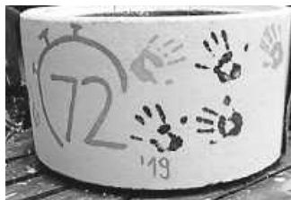
Einer von vielen Blumenkübeln im Dorf, der bei der letzten 72-Stunden-Aktion bemalt wurde.

Vom 18. bis zum 21. April findet die diesjährige 72-Stunden-Aktion des BDJG statt, an der auch die KJG Zimmern wieder teilnimmt. Die 72-Stunden-Aktion ist eine Sozialaktion, bei der in 72 Stunden in ganz Deutschland Projekte jeglicher Form umgesetzt werden. Im Zuge dessen findet am 21. April ab 15 Uhr auf dem Arche-Vorplatz ein Abschlussfest statt, an dem die Vorstellung unseres Projektes erfolgt und zu dem wir die ganze Gemeinde herzlich einladen. Für das leibliche Wohl ist gesorgt und wir freuen uns über viele Besucher und Besucherinnen.