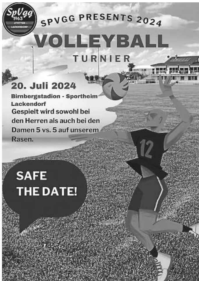
SpVgg Volleyballturnier 2024