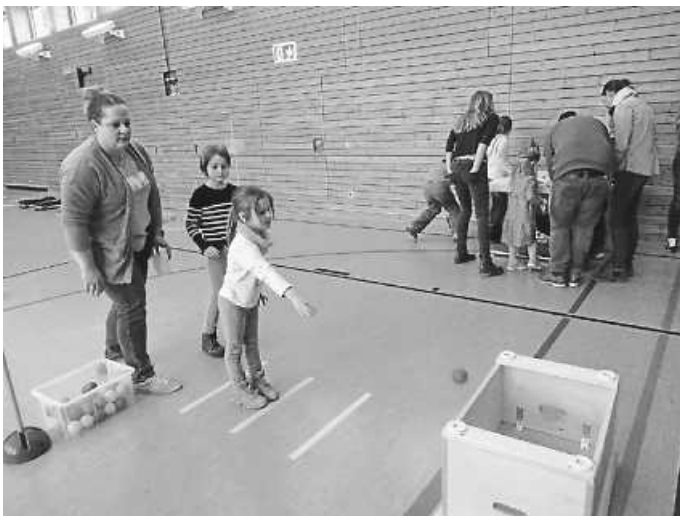
Die Kinder mit ihren Eltern beim Parcours

In diesem Jahr gestalteten wir unser traditionelles Sommerfest etwas anders. In der Osterzeit veranstalteten wir ein Familienfest, wobei sich alles um das Thema Ostern und Hasen drehte. Zu Beginn des Festes zeigten die Kinder ihren „Hasentanz“ und luden die Eltern und Geschwister zum Mitmachen ein. Im Anschluss konnte man verschiedene Stationen besuchen, an denen man Aufgaben und Übungen bewältigen musste. Auf dem Hof des Kindergartens und in der Turnhalle waren hierzu die verschiedenen Stationen aufgebaut. In der Turnhalle galt es einen ganzen Parcours mit unterschiedlichen Spielen und Aufgaben zu meistern. Beispielsweise eine Schokoeiersuche im Bällebad oder einen Slalom-Eierlauf.