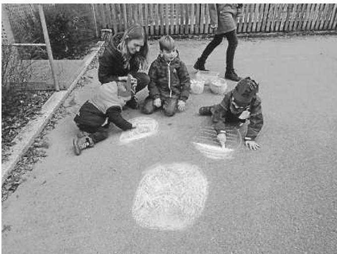
Ein buntes Osterei gemeinsam malen- eine Aufgabe beim Spiel „Eierdrehen“

An den weiteren Stationen konnte man Eier bunt färben, einen „Karottenweitwurf“ machen, Eierpusten, einen Eierbecherlauf und das Spiel „Eierdrehen“ bei dem man ebenso verschiedene Aufgaben lösen musste.