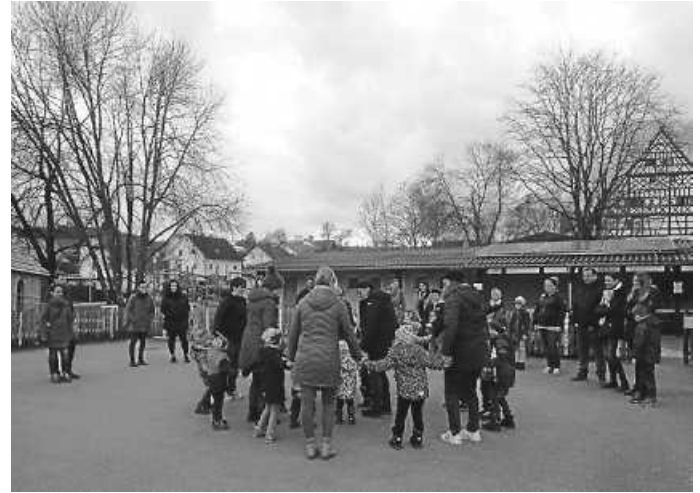
Beim gemeinsamen Hasentanz

schluss ein bunter Snackosterhase gelegt. Zudem hatte jede Familie einen leckeren Snack hierfür mitgebracht. Zwischendurch bestand immer die Möglichkeit, einfach zu verweilen, die Stationen noch mal anzugehen oder Zeit mit den anderen Kindern und Familien zu verbringen. Das Fest rundeten wir zum Abschluss noch einmal mit dem „Hasentanz“ ab. Gemeinsam hatten wir eine schöne Zeit und das Fest war rundum gelungen, an dem sich die Kinder bestimmt noch lange erinnern werden.