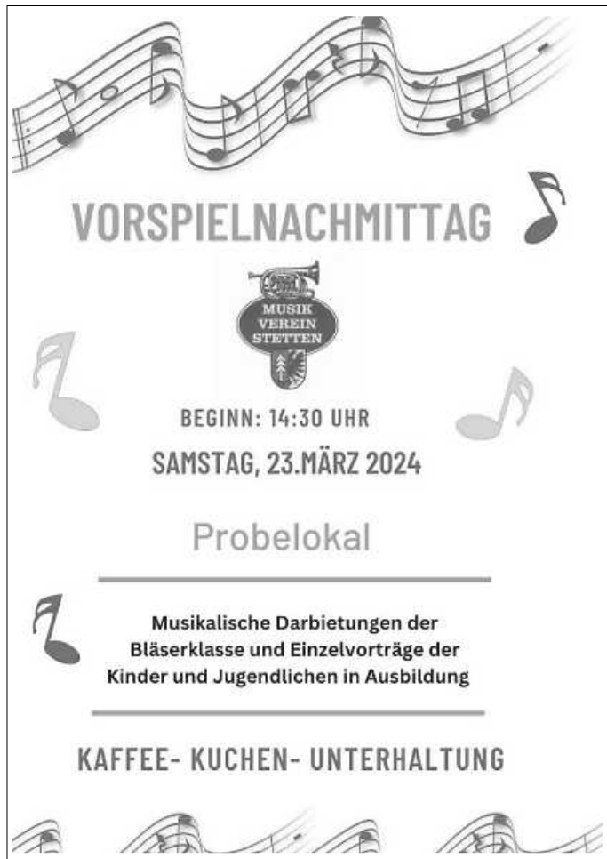
Plakat: MV Stetten

Am Samstag, 23.03. findet um 14.30 Uhr unser diesjähriger Vorspielnachmittag statt. Die Kinder und Jugendlichen haben fleißig geübt, um Interessierten ein tolles Programm bestehend aus Einzelvorträgen und Ensembles präsentieren zu können. Kommen Sie gern vorbei!