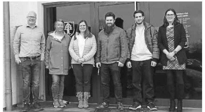
Delegation der Stadt Tettngang besucht die Gemeinde Zimmern in Sachen Digitalisierung.

Die Stadt Tettngang sammelte viele wichtige Informationen für die Praxis und für die Entscheidungsfindung von Programm und Umsetzungsplan. Ziel der Stadt Tettngang ist es, als erste Kommune im Bodenseekreis den elektronischen Posteingang einzuführen.