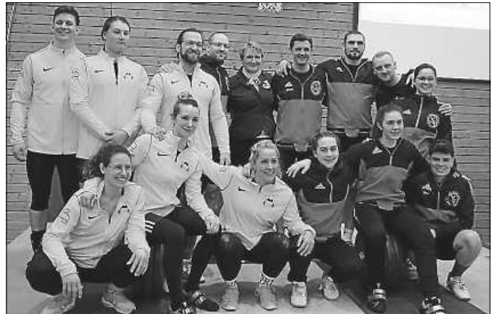
KSV Lörrach und SV Flözlingen

Es lief besser als erwartet. Gegen unseren Mitkonkurrenten aus Lörrach behielten wir jederzeit die Oberhand und gewannen verdient mit 436,0 zu 295,6 RP. Damit haben wir auch den bisherigen Topwert des SV Magstadt mit 430,8 RP aus der Landesliga Mitte überboten und sicherten uns das Heimrecht für die Aufstiegskämpfe zur Oberliga. Laut vorläufigem Terminkalender des Baden-Württembergischen Gewichtheberverbandes wird dieser am Samstag, 4. Mai stattfinden.