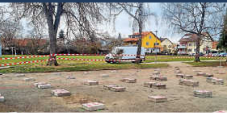
Vorbereitung für Stellen der Container Grund- und Werkrealschule - Fertigung und Stellen des Fundamentes