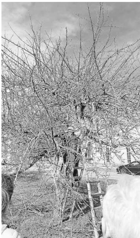
Viel Arbeit hatte Kramer, bis man wieder sehen konnte, dass es ein Baum ist.

Für die immer kleiner werdenden Bauplätze und folglich der Hausgärten empfahl er nur noch schwach wachsende Bäume zu pflanzen. Nun ging es zum eigentlichen Schnitt, dazu hatte er sich ein besonders verwildertes Exemplar ausgesucht.