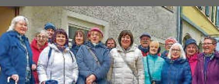
Zimmerner Spaziergang- Gruppe: Besuch in der Wärmestube in Rottweil