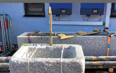
Sanierung Wasserretzanlage Horgen begonnen