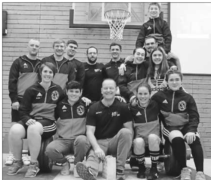
Abschlussbild aller Aktiven und Betreuer zum Ende der Landesliga Gruppe Mitte