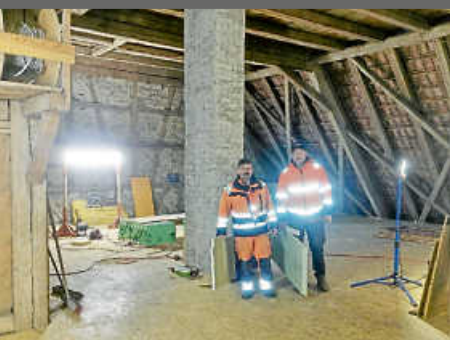
Ausbau und Isolierung Dachboden Rathaus Stetten