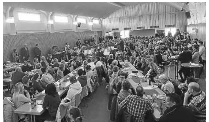
Der Musikverein konnte sich über eine voll besetzte Halle freuen

Am Sonntag, 03. Dezember lud der Musikverein Zimmern o. R. erstmalig zu einem Kinderkonzert in die Turn- und Festhalle ein. Bereits vor Saalöffnung tummelten sich Zuhörerinnen und Zuhörer vor der Halle, darunter zahlreiche märchenbegeisterte Kinder.