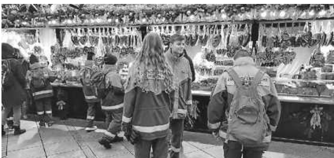
Auf dem Weihnachtsmarkt