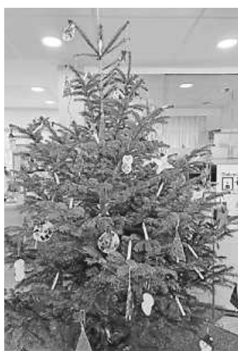
Der geschmückte Tannenbaum in der Volksbank Zimmern.

Die Kinder und ihre Mamas waren sehr fleißig und haben gemeinsam viel Christbaumschmuck gestaltet.