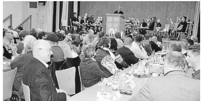
Wir freuen uns auch dieses Jahr wieder über zahlreiche Besucher

Nach dem Mittagessen wird der Missionsausschuss UBUCUTI Kaffee und Kuchen zugunsten des Ruanda-Missionsprojekts anbieten. Die JU Zimmern würde sich über zahlreiche Besucher freuen. Der Beginn der Veranstaltung am 17.12. ist um 11:30 Uhr.