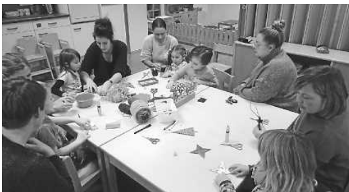
Die Kinder und Eltern beim Gestalten der Tannenbäume und Sterne falten.