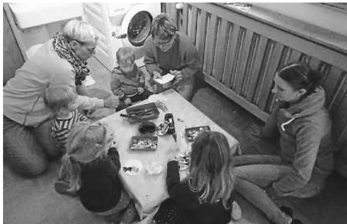
Bunte Christbaumkugeln und Schneemänner werden gestaltet.

Es war ein schöner Nachmittag, mit vielen fleißigen „Bastlern“, netten Gesprächen und einer schönen Atmosphäre bei weihnachtlicher Musik.