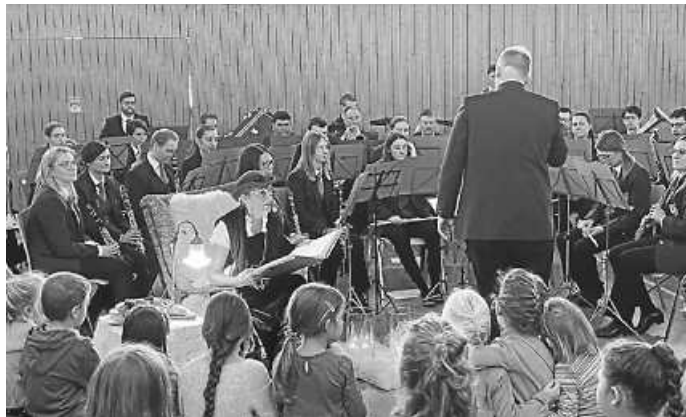
Gespannt tauchen die jüngsten Zuhörer in die märchenhafte Welt von „Schneewittchen“ ein