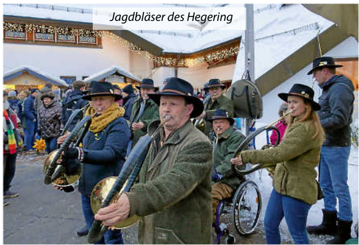
Jagdbläser des Hegering