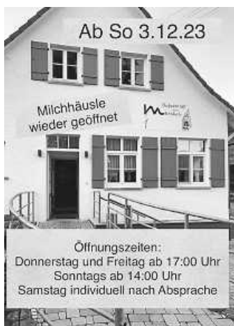
Neue Öffnungszeiten im Milchhäusle

Wenn Sie Interesse an einem Genossenschaftsanteil haben, melden Sie sich gerne per E-Mail ( milchhaeusle-stetten-e-g@gmx.de ) oder persönlich bei uns.