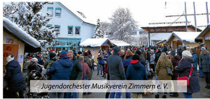
Jugendorchester Musikverein Zimmern e. V.