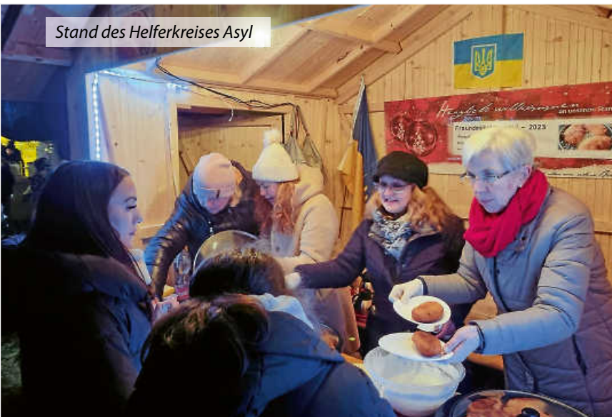
Stand des Helferkreises Asyl

Sie alle haben zum Erfolg des diesjährigen Adventsmarktes 2023 beigetragen.