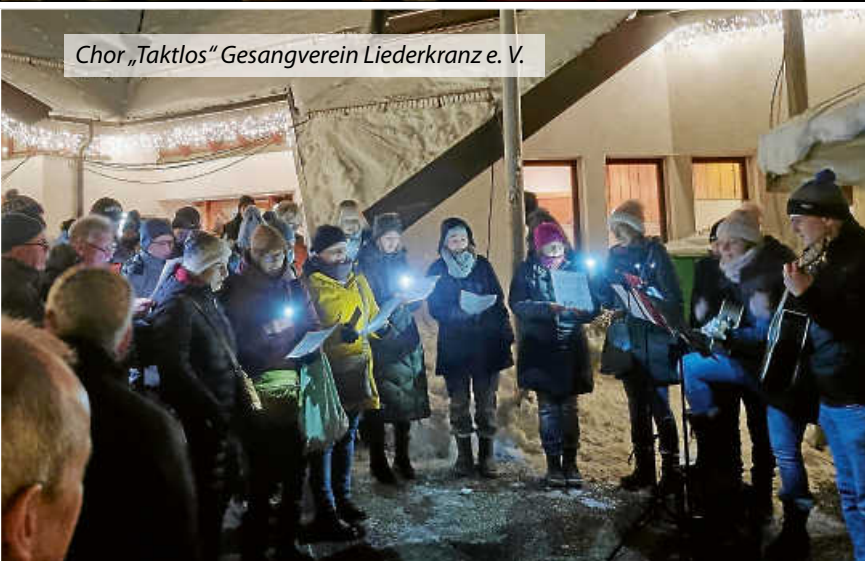
Chor „Taktlos“ Gesangverein Liederkranz e. V.