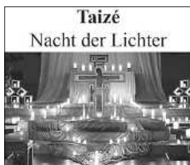
Nacht der Lichter

9.30 Uhr – Abschluss des Weihnachtsweges in der Kirche in Flözlingen (Pfarrerin Reichle und Tanja Fischer)