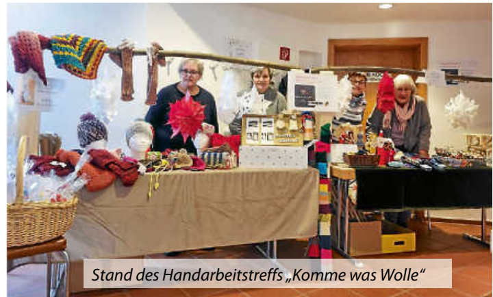
Stand des Handarbeitstreffs „Komme was Wolle“