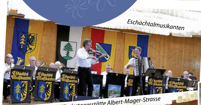
Auftritt Kindertagesstätte Albert-Mager-Strasse