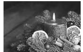
1. Advent

Wir singen gemeinsam schöne Adventslieder in gemütlicher Atmosphäre. Stimmungsvoll wird außerdem eine weihnachtliche Geschichte vorgetragen. Ausklingen lassen wir unser Beisammensein bei einem Café und einem leckeren Stück Kuchen.