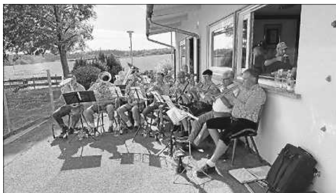
Die Lausitzer des MV Zimmern

Besonders bedanken wir uns bei der KJG Zimmern für die Übernahme der Bewirtung als Ausgleich für die bisherige und künftige Nutzung unseres Vereinsheimes für Veranstaltungen und bei den Lausitzer des Musikverein Zimmern für die schöne musikalische Unterhaltung.