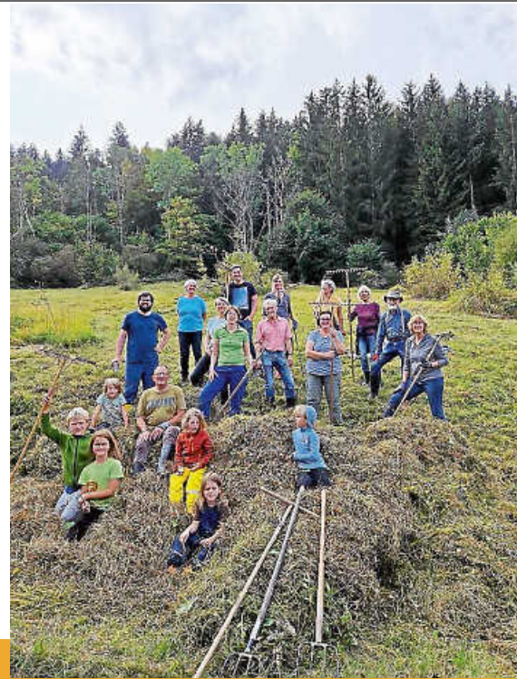
Fleissige Helfer am Gallisried 2023

Um das Gallisried als Kleinod der Artenvielfalt zu erhalten, sind jedes Jahr im Herbst auch engagierte Bürgerinnen und Bürger eingeladen, bei der Pflegearbeit mitzuhelfen. Denn nur das Bewusstsein über dessen Besonderheit kann den Erhalt dieses Lebensraumes auf lange Zeit sichern. Zu den wichtigsten Schutzmaßnahmen zählt letztendlich die Rücksichtnahme aller. So ist darauf zu achten, dass keine Pflanzen gepflückt oder Tiere gefangen werden. Ein schönes Foto ist eine langlebigere Erinnerung.