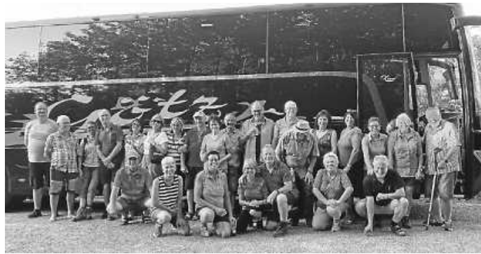
Ausflug Jedermänner 2023

In Summe wieder ein toller Tag und ein gelungener Ausflug. Fortsetzung folgt in 2024!