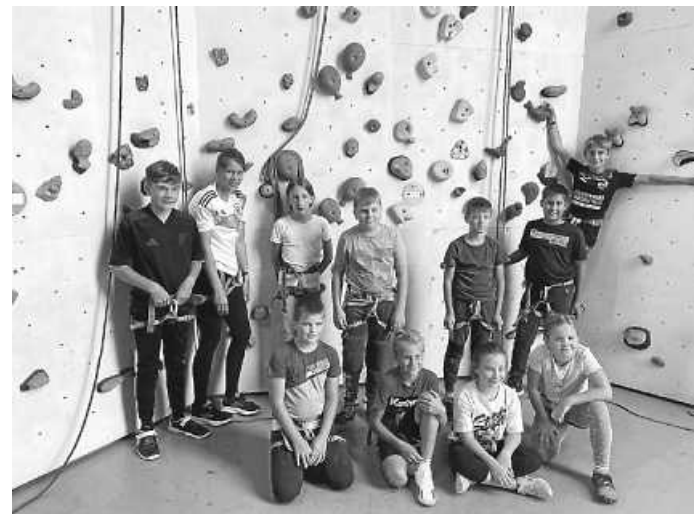
Gruppenbild beim Klettern im K5