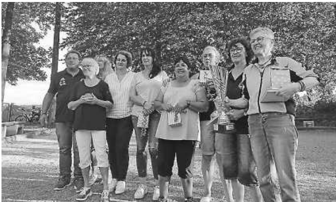
Freude über einen erfolgreichen Verlauf