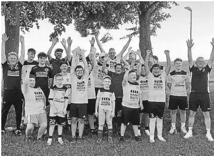
Unsere Siegermannschaft Herzlichen Glückwunsch!