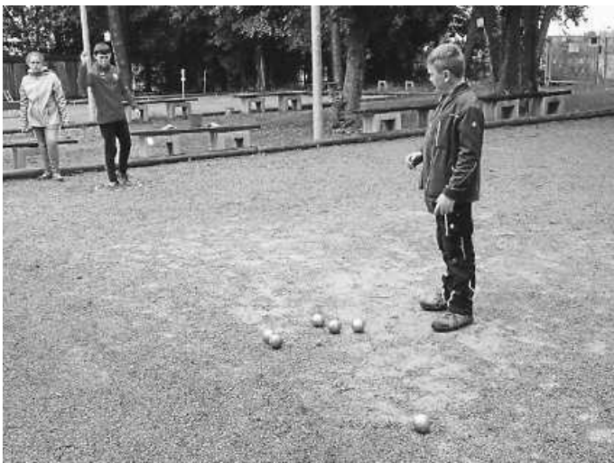
Die feuchten Platzverhältnisse machten den Akteuren nichts aus

Am diesjährigen Angebot zum Boulespiel in den Schulferien nahmen 9 Kinder teil. Wegen des wechselhaften Wetters wurde auf die gewohnte Bepunktung an den verschiedenen Übungsstationen verzichtet, da der Regen gelegentliche Unterbrechungen erzwang. Unter den Kindern war die Stimmung trotzdem gut, Getränke, ein Vesper und ein kleines Geschenk rundeten den Nachmittag ab.